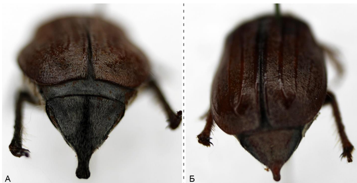
Рисунок 3 – Пигидий Melolontha hippocastani hippocastani (Fabricius, 1801) (А – самец, Б – самка); локация: Гулькамские теснины (каньон)