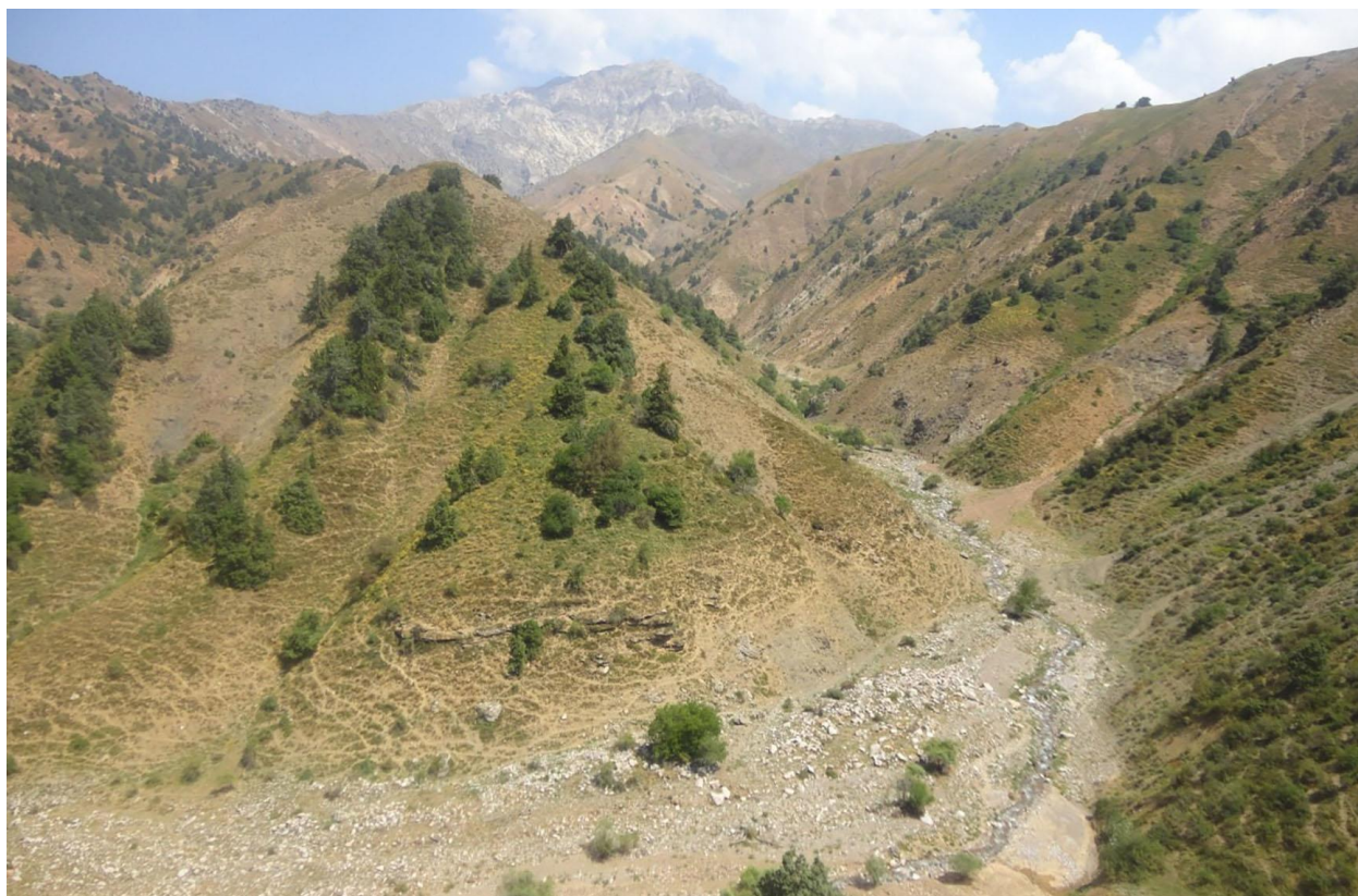
Рисунок 1 – Гора Малый Чимган (на заднем плане) и Гулькамские теснины (каньон)

Среди последних сборов полевого материала нами было выявлено 18 видов пластинчатоусых жуков, которые относятся к 6 подсемействам (Aphodiinae, Cetoniinae, Dynastinae, Melolonthinae, Rutelinae, Scarabaeinae) и 10 трибам (Adoretini, Aphodiini, Cetoniini, Coprini, Gymnopleurini, Melolonthini, Oniticellini, Onitini, Onthophagini, Oryctini). Ниже приводим аннотированный список выявленных видов в 2016 году в предгорье Малого Чимгана (Западный Тянь-Шань).