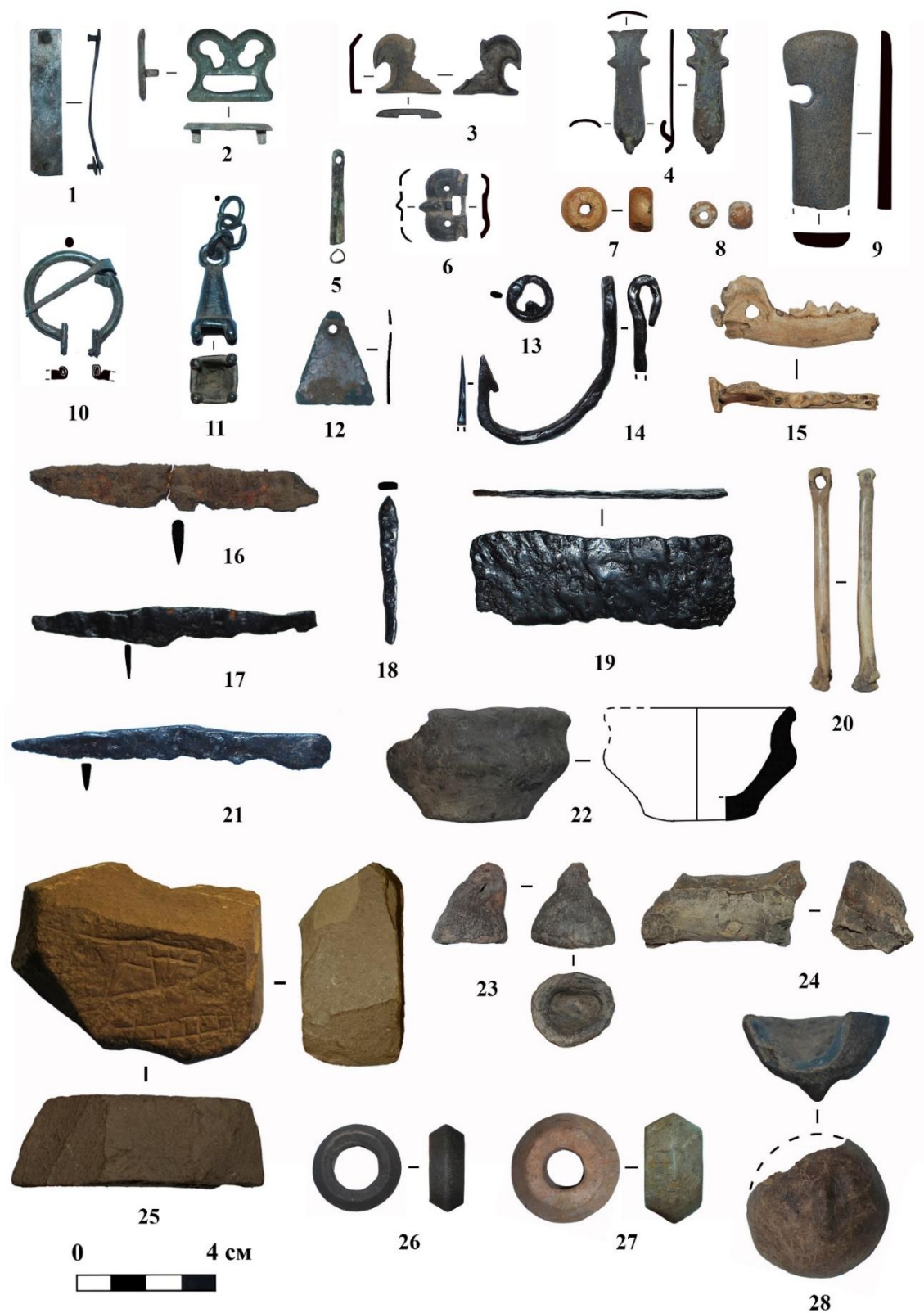
Рис. 3. Находки с Иваньково-Ленинского городища «Шолм»: 1-6, 10-12 – бронза, 7-8 – стекло, 13-14, 16-19, 21 – железо, 9, 15, 20 – кость, 22-24, 26-28 – керамика, 25 – камень.