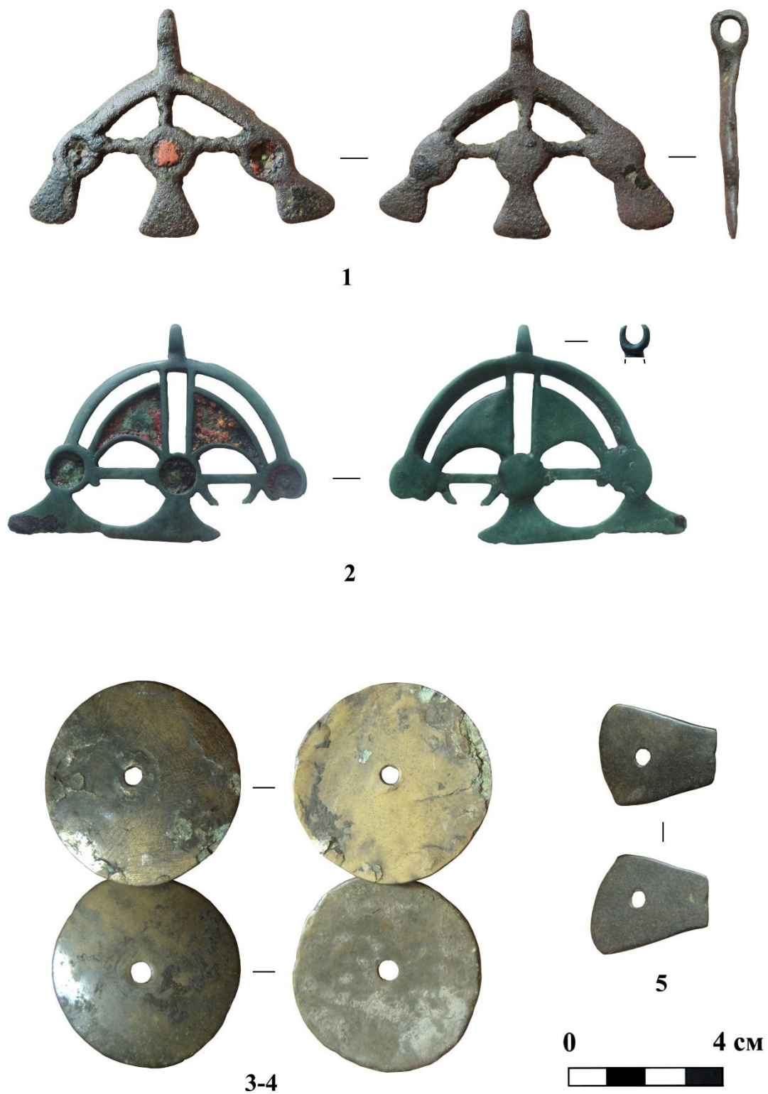
Рис. 5. Находки с Напольновского 1 селища: 1-2 – бронза, эмаль, 3-5 – бронза.