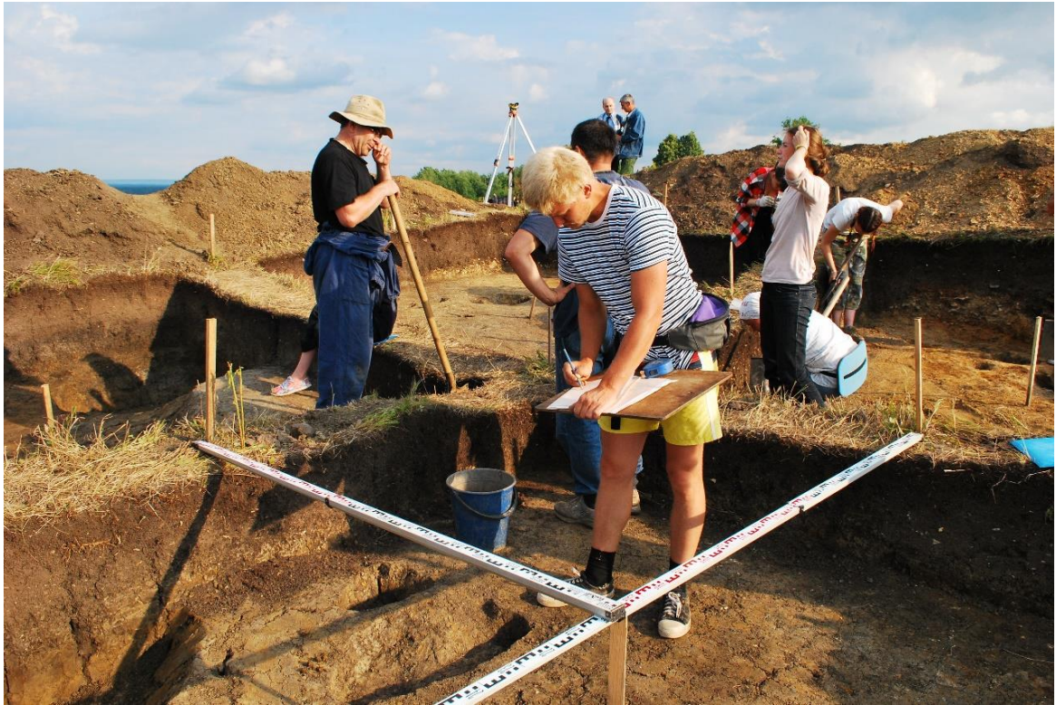
Рис. 1. Работа на Иваньково-Ленинском городище «Шолм». Раскопки 2015 г.