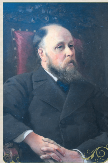
А.И. Корзухин. Портрет Дмитрия Ивановича Стахеева.