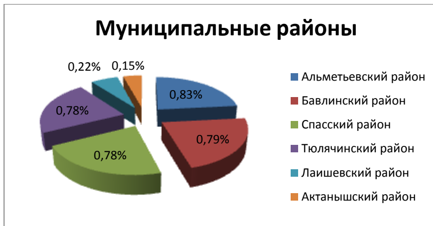
Рисунок 1 - Уровень безработицы в муниципальных районах Республики Татарстан

Среди муниципальных районов Республики Татарстан самый высокий уровень безработицы рассматривается в Альметьевском районе, что составляет 0,83 %, самый низкий уровень в Актанышском районе 0,15 %.