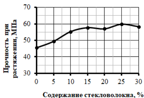
Рис. 3 - Концентрационные зависимости прочность при растяжении ПВХ-образцов от содержания стекловолокна

направлении приложения сдвиговых сил. Из данных рис.3 видно, что, начиная примерно с 15% стекловолокна, происходит снижение эффекта усиления, кривая прочность-концентрация практически выходит на плато. Очевидно, при увеличении концентрации стекловолокна начинают оказывать больший вклад взаимодействия не полимер-наполнитель, а наполнитель-наполнитель, то есть по существу перераспределение напряжений при нагружении образцов уменьшается. Образцы становятся более хрупкими, о чем свидетельствует уменьшение деформируемость при растяжении. Эффект повышения прочности при малых концентрациях стекловолокна наблюдалось в ряде работ [9].