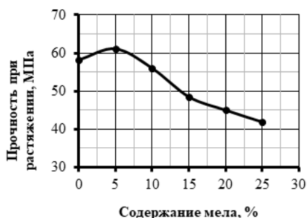
Рис. 4 -Концентрационные зависимости прочность при растяжении ПВХ-образцов (15 масс.% СВ) от содержания мела

В композициях, содержащих стекловолокно и мел, кривые зависимости разрывной прочности образцов проходит через небольшой концентрационный максимум при содержании мела 5% (рис.4). Очевидно, что малые концентрации высокодисперсного гидрофобного наполнителя (размеры которых соизмеримы с размерами глобулярных образований) проявляют «эффект микроармирования».