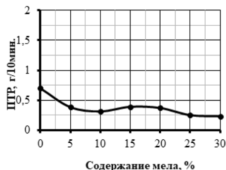
Рис. 2 - Изменение ПТР ПВХ-композиций (15 масс.% СВ) от содержания мела

В ПВХ-композиции с содержанием 15% СВ осуществлено введение мела (0-30 масс.%) и определено его влияние на текучесть расплава (рис.2).