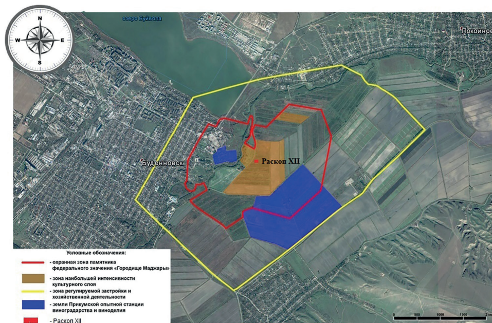
Рис. 1. Расположение раскопа XII на территории Маджарского городища.