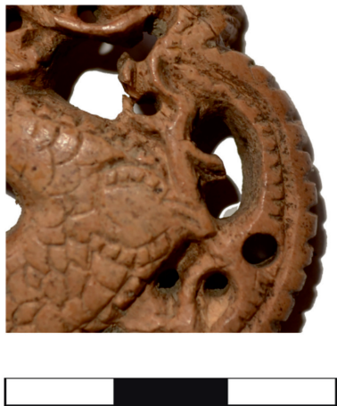
Рис. 4. Фрагмент костяной накладки с изображением дракона.