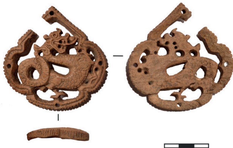
Рис. 3. Костяная накладка с изображением дракона.