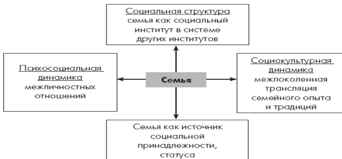
Рис. 1. Социологический анализ семьи в единстве структурных и динамических координат

По оси социальной структуры семья рассматривается как подсистема общества, социальный институт, осуществляющий взаимодействие с другими социальными институтами и с обществом в целом. Структурный подход устанавливает место семьи в иерархии институтов, фиксирует функции семьи, которые важны для ее понимания в обществе. В то же время семья рассматривается как источник социальной принадлежности.