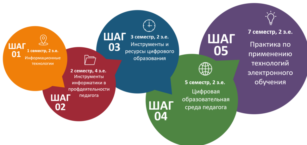
Рисунок 1. Логика цифровой подготовки будущего учителя

Профессионально-педагогические компетенции – группа компетенций, связанных с использованием методов и инструментов построения цифровой образовательной среды, управления образовательным процессом, решением профессионально-педагогических задач в цифровой среде.