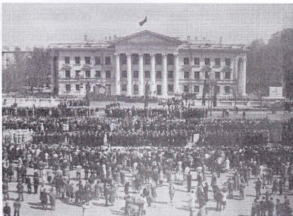
Рис. 2. г. Казань, пос. Дербышки. Парад Победы на площади перед ДК им. С.Саид-Галиева. 1975 г.

2-й земельный участок – территория парка, в центре квартала ограниченная улицами Советская, Энтузиастов, Тополевая, Начальная (Рис. 3). Территория парка примыкает к ул. Тополевая. С северной стороны к парку примыкает детский сад, с южной стороны – начальная и средняя школа, на востоке расположен стадион «Ракета», а на западе, вдоль ул. Энтузиастов расположены жилые дома. Территория парка имеет зоны, такие как: отдыха, мемориальная, прогулочная, площадка для выгула собак, детская площадка и др. Парк имеет смешанный характер, представлен различными видами хвойных и лиственных деревьев, такими как сосна обыкновенная, ель колючая, береза повислая, клен ясенелистный, липа мелколистная, тополь бальзамический.