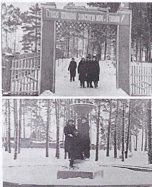
Рис. 3. Парк за ДК им. С.Саид-Галиева. 1970-1980 гг.

2-й земельный участок – территория парка, в центре квартала ограниченная улицами Советская, Энтузиастов, Тополевая, Начальная (Рис. 3). Территория парка примыкает к ул. Тополевая. С северной стороны к парку примыкает детский сад, с южной стороны – начальная и средняя школа, на востоке расположен стадион «Ракета», а на западе, вдоль ул. Энтузиастов расположены жилые дома. Территория парка имеет зоны, такие как: отдыха, мемориальная, прогулочная, площадка для выгула собак, детская площадка и др. Парк имеет смешанный характер, представлен различными видами хвойных и лиственных деревьев, такими как сосна обыкновенная, ель колючая, береза повислая, клен ясенелистный, липа мелколистная, тополь бальзамический.