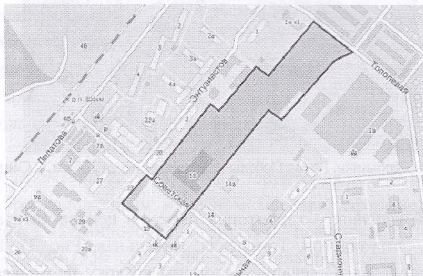
Рис. 1. Месторасположение территории ДК им. С.Саид-Галиева

Сиринусом. Дворец Культуры является объектом, обладающим признаками объекта культурного наследия в соответствии с Федеральным законом от 25 июня 2002 г. N 73-ФЗ «Об объектах культурного наследия (памятниках истории и культуры) народов Российской Федерации».