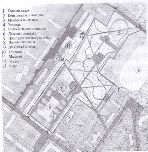
Рис. 6. Схема территории парка ДК им. С.Саид-Галиева 2015-2016 гг.

Первый этап реконструкции территории парка и площади перед ДК им. С.Саид-Галиева уже были выполнены. На территории обновленной площади высажены кустарники, посеян газон, установлены малые архитектурные формы. Главным архитектурным обновлением площади, безусловно, стал облицованный гранитом фонтан, в котором заменили насосную станцию. В парке, примыкающем к Дворцу культуры, также установлены малые архитектурные формы, построили детскую площадку. Аллеи облагороженной территории отдыха выложены тротуарной плиткой. Также там высадили кустарники и постелили газон. Еще одна особенность сквера – специальная площадка для выгула собак. Небольшой комплекс представляет собой огороженную территорию с рядом препятствий и барьеров для тренировок и игр собак.