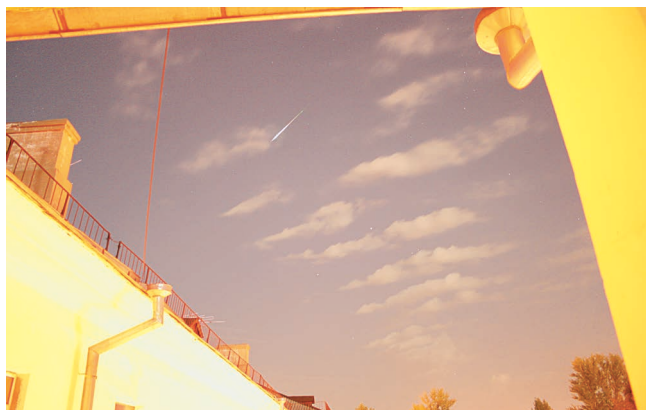
Яркий метеор потока Персеид 13 августа 2011 г., 0 ч 40 мин по московскому времени. Использовался фотоаппарат "Canon EOS400D" – объектив "Canon EF518-55 mm" (kit), фокусное расстояние 18 мм, диафрагма f/3.5 , выдержка 15 с, ISO 1600.

размере матрицы фотоаппарата и времени съемки это количество можно примерно оценить как пропорциональное D^2/f^5 . Таким же образом можно ожидать, что при фиксированной выдержке количество звезд в кадре будет коррелировать с величиной D^2/f^2 , которая также определяет фон неба.