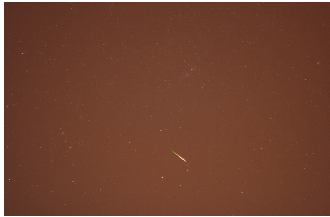
Метеор потока Персеид 11 августа 2012 г., 22 ч 55 мин по московскому времени. Использовался фотоаппарат “Canon EOS400D” (объектив “Гелиос-44”, выдержка 8 с, ISO 800).

Один из способов удешевления производства светосильных объективов (при сохранении приемлемого уровня aberrации) – использование штампованных асферических линз из органического стекла (правда, существует опасность их растрескивания при очень низких температурах). По такому пути пошла южнокорейская компания “Samyang” (выпускает объективы также под марками “Rokinon” и “Bower”). К ее наиболее “светосильным” моделям относятся объективы: 21 mm f/1.4 – только для беззеркальных фотоаппаратов; 24 mm f/1.4; 35 mm f/1.4; 50 mm f/1.2; 50 mm f/1.4; 85 mm f/1.2; 85 mm f/1.4.