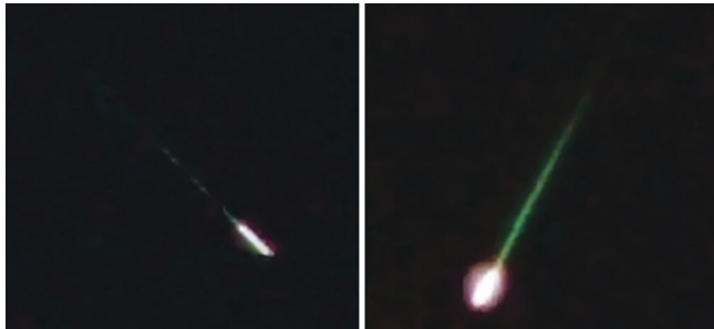
Спорадический метеор 13 августа 2014 г., 0 ч 49 мин (слева) и метеор потока Персеид 12 августа 2015 г., 23 ч 34 мин по московскому времени (справа). В обоих случаях показана часть кадра из видеозаписи (использовался фотоаппарат “Sony α NEX-5T”, объектив “SLR Magic Hyperprime CINE II 35 mm T0.95”, выдержка 1/25 с, ISO 6400).

некоторых графических редакторов (например, “GIMP”) или специальных онлайн-конвертеров.