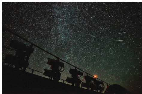
Поток Персеид 13–14 августа 2015 г. На переднем плане расположен инструмент “Mini-MegaTORTORA”, на котором в это же время проводятся научные наблюдения метеоров.

расстоянием 180 мм и светосилой f/1.2 , электронно-оптический преобразователь, матрица “Sony ICX285AL”. Также при поддержке ИНАСАН выполняются телевизионные наблюдения в Иркутске и в Рязани.