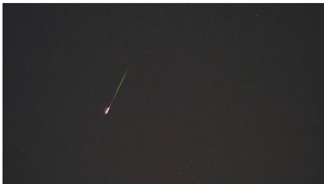
Метеор потока Персеид 13 августа 2016 г., 1 ч 58 мин по московскому времени (кадр из видеозаписи). Использовался фотоаппарат “Sony α NEX-5T”, объектив “SLR Magic HyperPrime 50 mm F0.95”, выдержка 1/25 с, ISO 6400. Анимация всего явления доступна по ссылке: https://yadi.sk/i/xiW02nm03ZXbGK .

Современные программы для обработки астрономических изображений позволяют не только преобразовывать форматы файлов, полученные с помощью цифрового фотоаппарата, они (в большей или меньшей степени) автоматически “распознают” сфотографированный участок неба, измеряют различные астрометрические и астрофизические величины. Сервис “Astrometry.net” удобен тем, что работает в режиме “онлайн” (не требует установки программы на компьютер пользователя). Уже