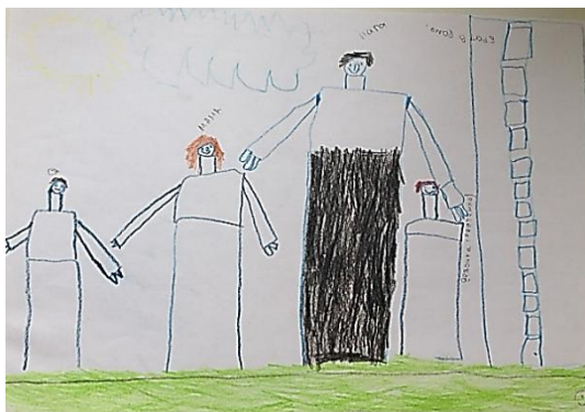
Рис. 3. Слева направо: Сережа, мама, папа, сестренка

На данном рисунке (рис. 2) мы видим мальчика и его отца. Мальчик использовал красный цвет при изображении себя. Это является показателем эмоциональной напряженности ребенка. Также нужно обратить внимание на солнце, которое выходит на первый план. Данное явление свидетельствует о том, что мальчику не хватает тепла в семье. Это и очевидно. Ведь Артем по каким-то причинам не нарисовал свою маму. Тела персонажей не прорисованы отчетливо. Линии, с помощью которых мальчик изобразил себя и отца говорят о импульсивности и эмоциональной неустойчивости. Нужно также отметить, что Артем и его папа изображены на нижней части листа, что является признаком заниженной самооценки ребенка. Таким образом, мы можем сказать, что Артем испытывает какое-то напряжение, тревожность. Это может быть связано с неблагоприятными обстоятельствами в семье.