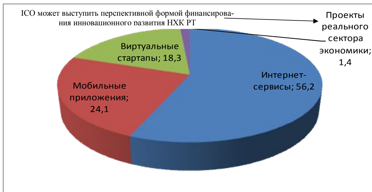
Рис. 2. Отраслевая структура ICO на виртуальных мировых рынках ка-

- в отличие от классического банковского кредитования, осуществление ICO не требует иммобилизации части имущества предприятий, получающего финансово-инвестиционные ресурсы, в форме залога.