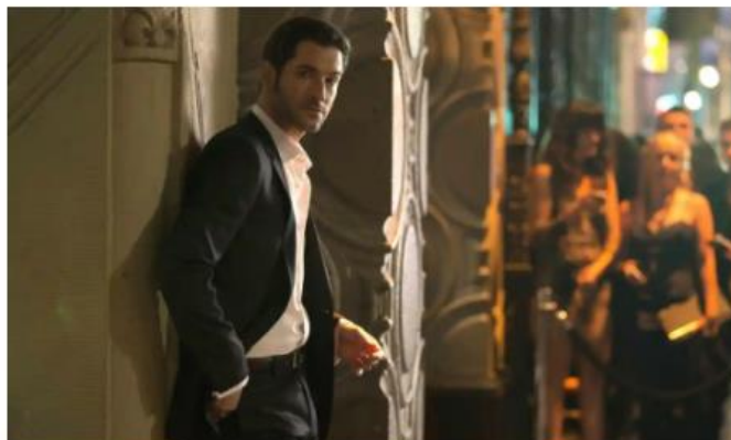
Lucifer: the devil wears a very nice suit.

Let me analyze an article named “Lucifer: the devil’s charismatic but the show is predictable as hell”.