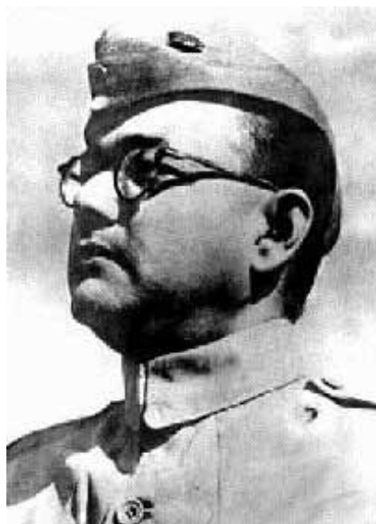
Субхас Чандра Бос: борец за независимость Индии, фашистский коллаборационист.

Почитаем в настоящее время наравне с Дж. Неру и М. Ганди. Для борьбы с английскими колонизаторами пошёл на сотрудничество с немцами, а затем с японцами, возглавив так называемый Индийский легион в составе вермахта (затем – войск СС).