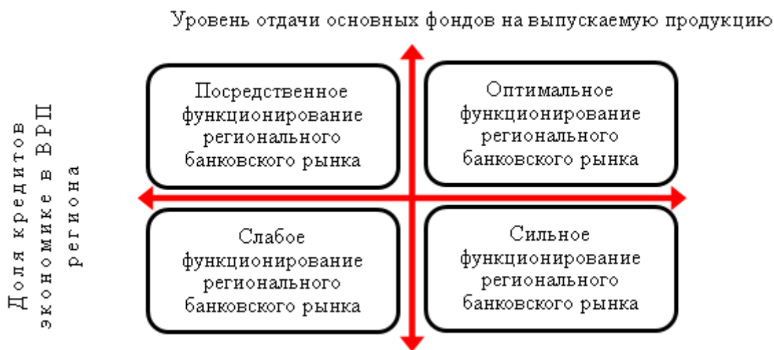
Рисунок – 1 Двухкритериальная матричная модель по определению привлекательности регионального банковского рынка в корпоративном сегменте среди регионов России [составлено авторами]

модель, внутри которой образуются четыре ячейки, области, как показано на рисунке 1, который отражает уровень отдачи основных фондов на выпускаемую продукцию. Как можно заметить из рисунка 1 каждой зоне дано название.