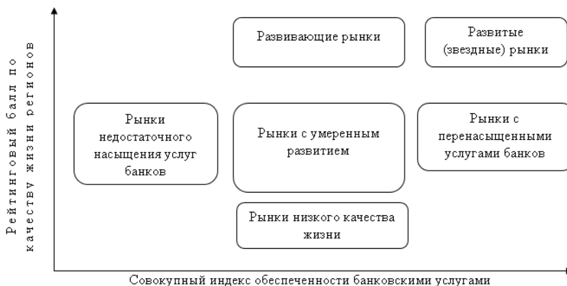
Рисунок – 5 Двухкритериальная матричная модель по определению привлекательности регионального банковского рынка на розничном сегменте среди регионов России [составлено авторами]

На рисунке 5 приведены итоговые результаты по степени развитости региональных банковских рынков России в рамках социального положения за 2018 г.