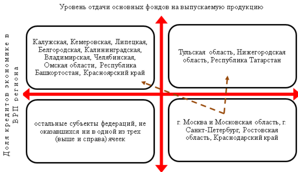
Рисунок – 3 Результаты матричной модели по определению привлекательности регионального банковского рынка в корпоративном сегменте среди регионов России [составлено авторами]

Более наглядно результаты рисунка 2 приведены на рисунке 3.