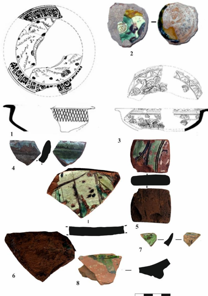
Рис. 1. Поливная керамика ширванского производства. Азак 1–3 (по С.А. Кравченко); Болгар 4–6; Мошаик 7, 8.

Fig. 1. Glazed Pottery of Shirvan production. Azak 1-3 (after S.A. Kravchenko); Bolgar 4-6; Moshajik 7, 8.