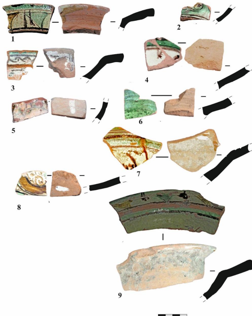
Рис. 4. Поливная керамика ширванского производства. Маджар (по И.В. Волкову)