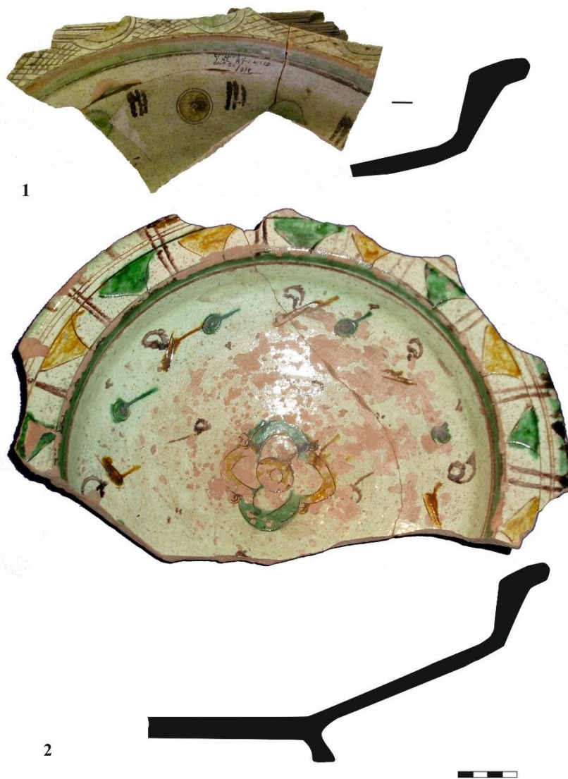
Рис. 3. Поливная керамика ширванского производства. Селитренное городище (по Р.Р. Валиеву, А.Г. Ситдикову и др).

Fig. 3. Glazed Pottery of Shirvan production. Silitrenoe site (after R.R. Valiev, A.G. Sitdikov and al.).