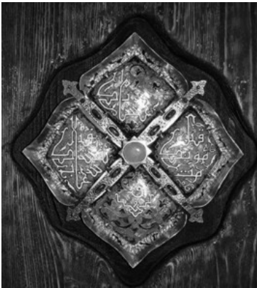
Рис.4 Ювелирный шамаиль в эмалевой технике современного казанского дуэта «Райдо» 2020г.

перерождение в современности. Ювелирный шамаиль становится отдельным направлением в татарском ювелирном искусстве, свидетельствуя тому современные работы художников-ювелиров (рис.4).