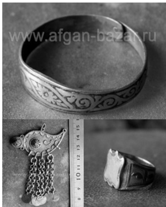
Рис.3 Примеры украшений Османской империи схожих с татарскими (www.afgan-bazar.ru)

Технология черни по серебру проявляется в татарских украшениях, особенно в браслетах, удивительно похожи методы замкового соединения (рис. 3).