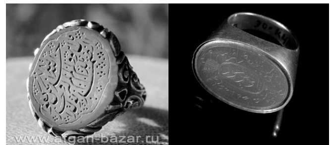
Рис.1 Сверху татарский перстень (НМРТ), снизу перстень из Ирана

ется то, что в иранских геммах текст зачастую бывает затонирован черным цветом, выемки заполняются смесью воска и туши, а в татарских старинных украшениях высеченные бороздки остаются естественного цвета (рис.1). Стоит отметить, что глиптика актуальна и в современном Иране, более того, тонирование текста также присутствует на современных работах камнерезов.