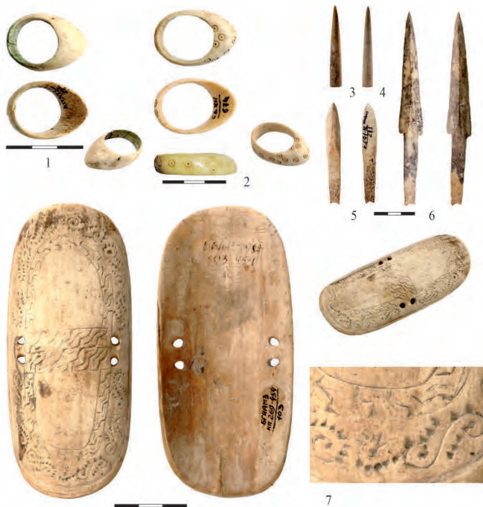
Рис. 5. 1–2 – втульчатые наконечники стрел; 3–4 – черешковые наконечники стрел; 5–6 – кольца для стрельбы из лука; 7 – щиток для защиты запястья при стрельбе из лука (по Баранов и др., 2016 а)