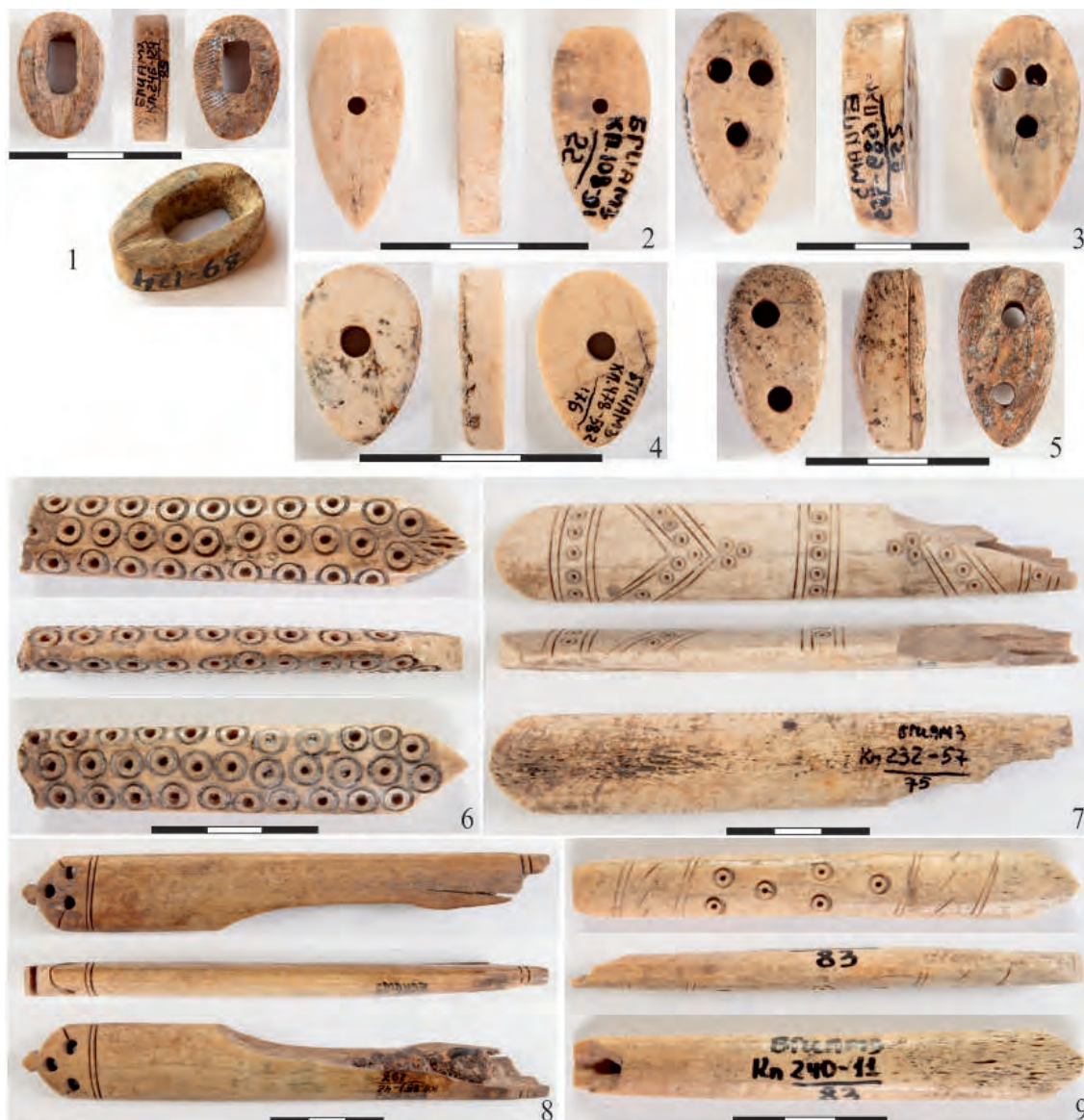
Рис.2. 1 – муфта рукояти ножа; 2–4 – затыльники рукоятей ножей; 5–9 – рукояти ножей (по Баранов и др., 2016б)

публикации материалов городов, существовавших только в золотоордынское время (Федоров-Давыдов, 1994, с. 174–179; Масловский, 2007; Недашковский, Моржерин, 2020).