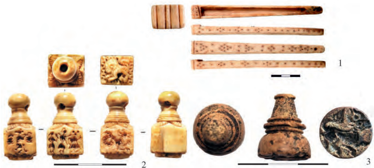
Рис. 4. 1 – пенал для калама (по: Баранов и др., 2016 б); 2–3 – костяные печати-матрицы шахматовидной формы (по: Бадеев, Яворская, 2017)