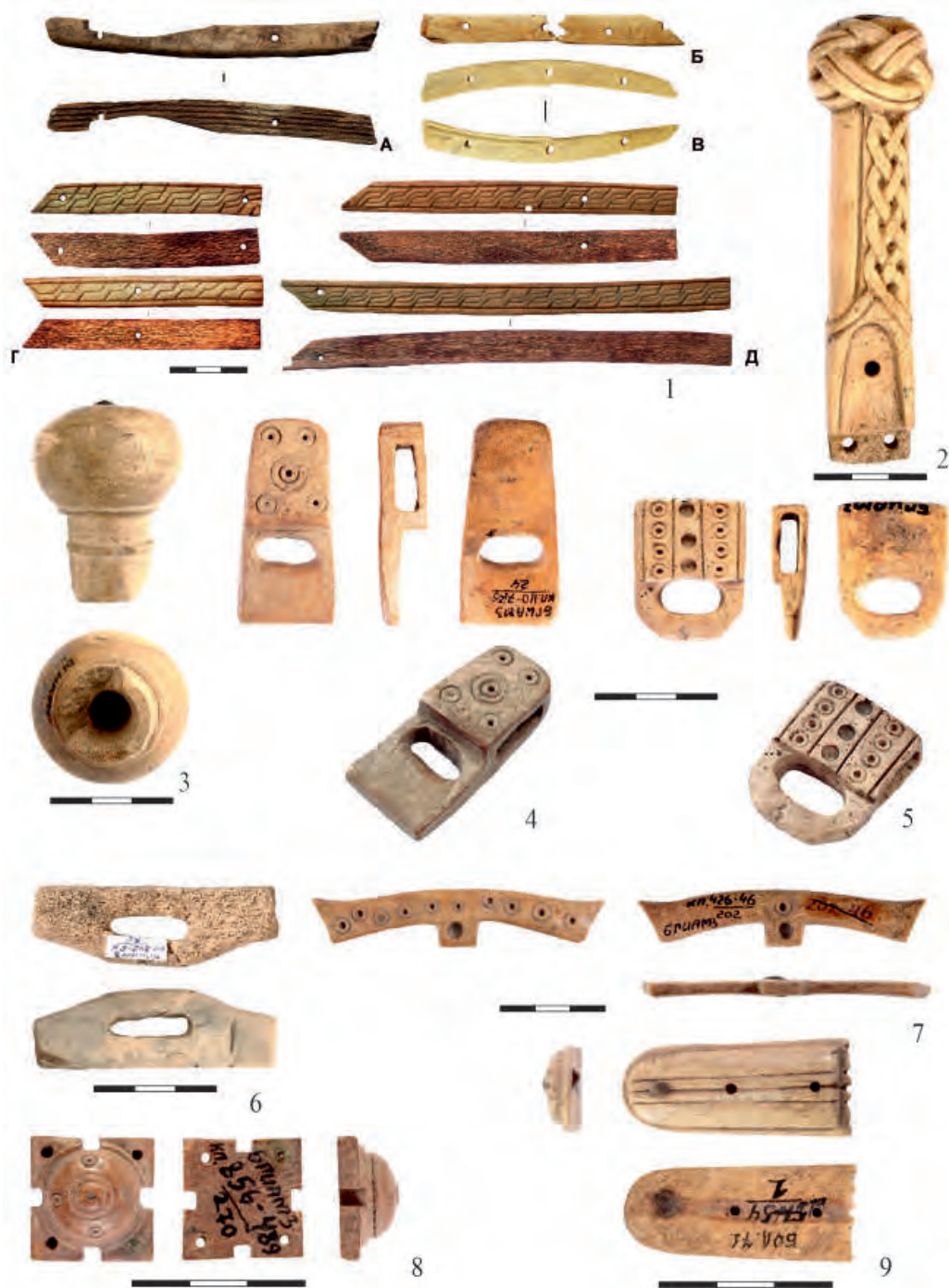
Рис. 6. 1 (А–Д) – седельные канты (накладки) (по: Яворская, Бадеев, 2019); 2 – рукоятка плети; 3 – удила; 4–5 – обоймы с петлей; 6 – застежка недоуздка (по: Баранов и др., 2016 а); 7 – застежка для недоуздка; 8 – накладка поясная, 9 – наконечник ремня (по: Баранов и др., 2016б)

ности преобладают рукоятки и их детали (рис. 2). Из кости и рога изготавливался широкий ассортимент кожевенных и ткацких орудий труда (рис. 3), письменные принадлежности (рис. 4: 1), а также такие статусные вещи, как печати (рис. 4: 2–3). На охоте и в военном деле кость и рог использовались в основном для оснащения лучников (рис. 5); в снаряжении лошади – как детали креплений и реже в качестве украшений; для об-