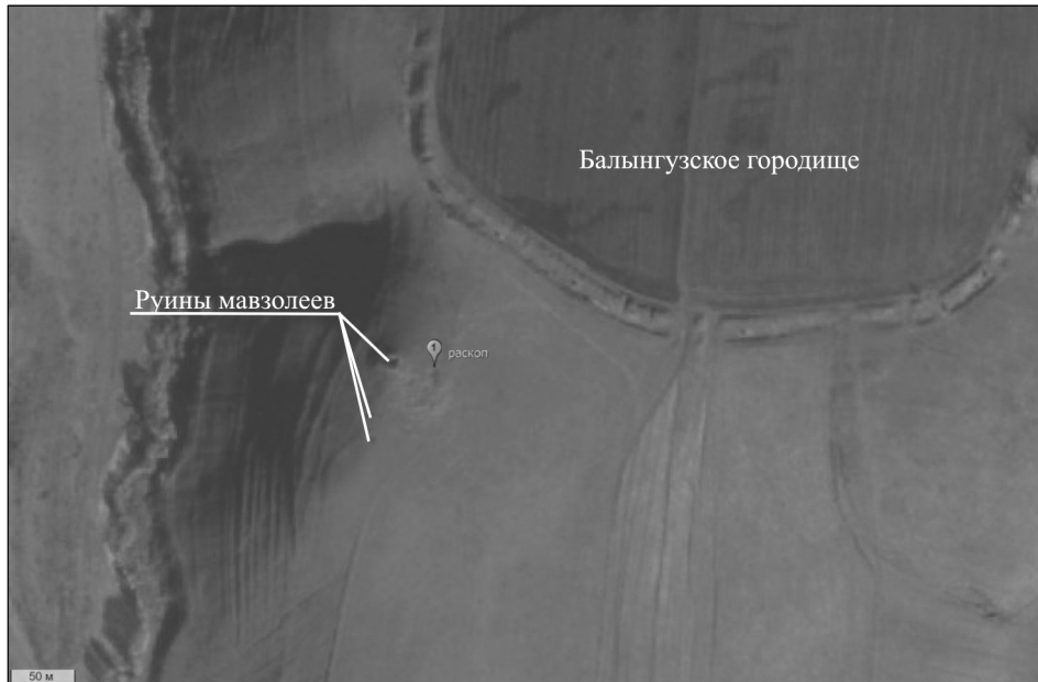
Рис. 1. Месторасположение раскопа на космическом снимке.