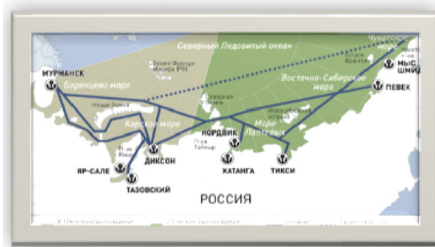
Рисунок 1. Северный морской путь и объём грузовой базы, млн. тонн

В 2017 году во время инициативной встречи лидеров двух государств: Председателя КНР Си Цзиньпина и Президента Российской Федерации В.В. Путиным была достигнута договоренность о совместном проекте развития и использования арктического морского пути и создания Ледового Шелкового пути – морской путь, который объединяет Северную Америку, Восточную Азию и Западную Европу – рисунок 1. Ледовый шёлковый путь, основным элементом которого Северный морской путь имеет огромное значение в условиях санкций и логистических ограничений западными странами транспортных путей России: «Таким образом, интерес в строительстве «Ледового Шелкового пути» обусловлен потенциальными энергетическими, коммерческими и геополитическими выгодами арктических и приарктических государств» [5, с. 34].