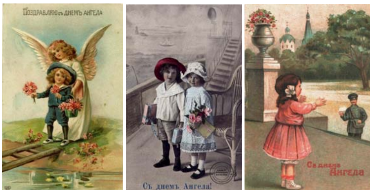
Рис. 1. Почтовые открытки с Днем Ангела

Было выпущено невероятно большое количество открыток, посвященных именно Дню Ангела, и это говорит о том, насколько в Российской империи именины повсеместно отмечались и что было принято непременно поздравлять родных и знакомых с этим праздником. На этих красочных открытках и просто чаще всего ставилась надпись «Поздравляю с Днем Ангела», но были и именные, посвященные «Ольге», «Надежде» и т. п. На одной из старинных открытках мы можем даже увидеть почтальона, вручающего поздравление с Днем Ангела (рис. 1).