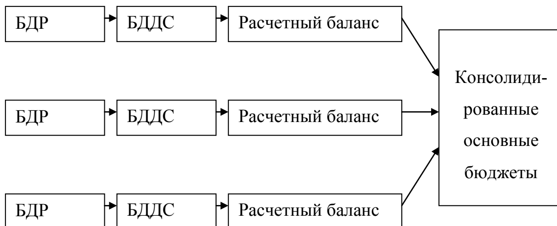
Рис 2. Консолидация финансовых бюджетов в холдинговой компании

В холдинговых структурах кроме этого осуществляется консолидация сводных финансовых бюджетов ЦФО в сводные финансовые бюджеты головной организации (рис.2)