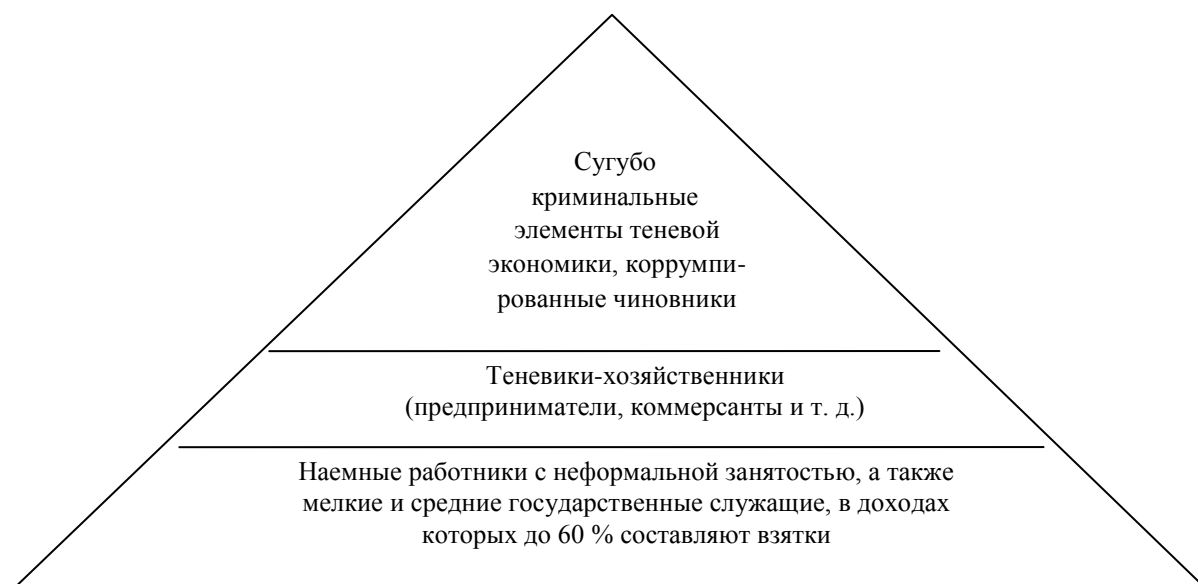
Рис.2. Субъектная структура неформальной экономики

Современная структура неформальной экономики представлена множеством связей между компонентами, наиболее характерными из которых являются связи координации (упорядоченность по горизонтали) и субординации (упорядоченность по вертикали). При этом она организована по принципу пирамиды, где действует множество социальных субъектов, специализирующихся на неформальной экономической деятельности. В общем виде пирамида субъектов неформальной экономики представлена исследователем в области неформальной экономики и России В. К. Сенчаговым (см.рис.2).