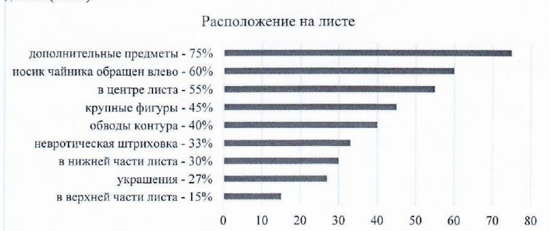
Рис.2. Расположение фигур на листе в проективной методике «Сахарница и заварочный чайник на праздничном столе» (Васина В.В.)

Обращается внимание на общее расположение рисунка на листе, размер, отдельные детали (Рис.2).