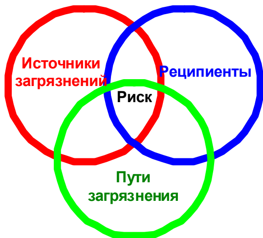
Рисунок 1.8.1. Взаимосвязанность факторов риска, приводящих к загрязнению окружающей природной среды

Если имеются основания полагать, что существуют все три фактора риска (несмотря на ограниченность данных) в нынешних или предполагаемых условиях, необходимо выполнить следующие действия (более подробно они рассматриваются в последующих пунктах настоящего раздела):