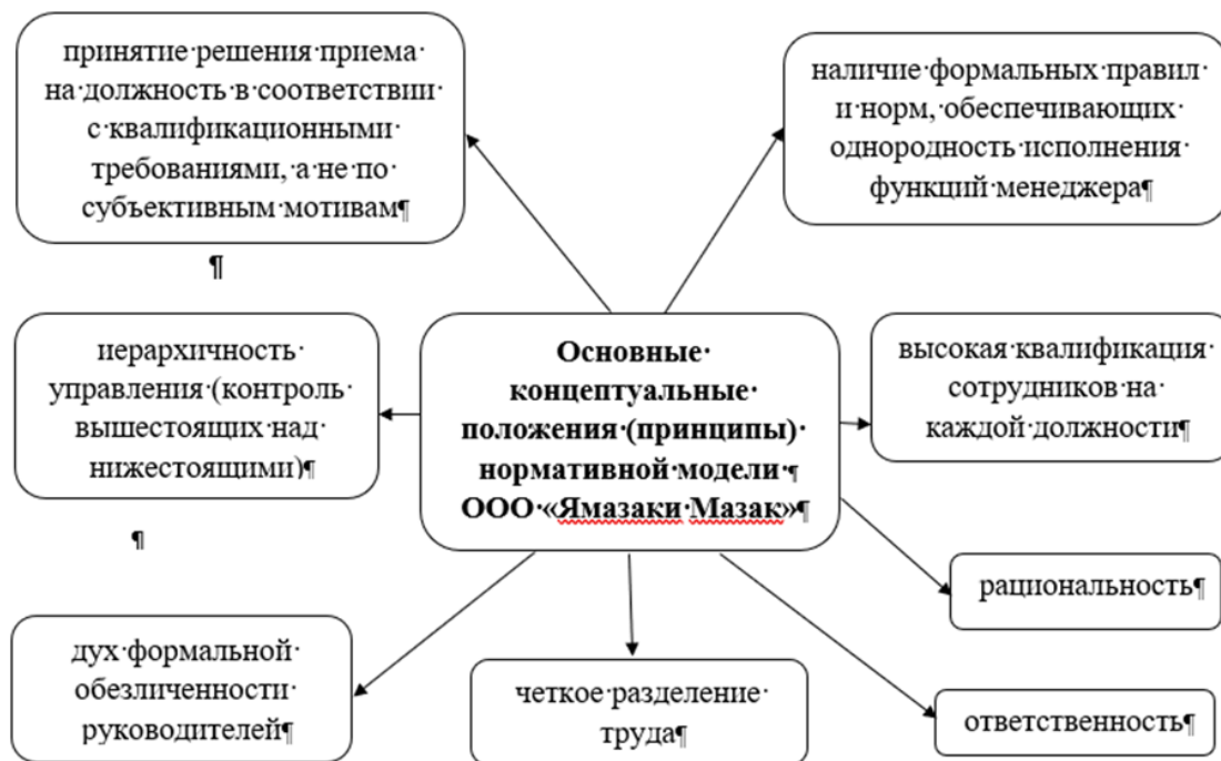
Рис. 2. Нормативная модель управления ООО «Ямазаки Мазак»

Анализ управленческой структуры связан с измерением внутренних координационных связей предприятия – от руководителя до исполнителя на самом близком к клиенту звене, что позволит дать достаточно полную организационно-экономическую характеристику компании ООО «Ямазаки Мазак». Наиболее интересным в плане организации внешнеэкономической деятельности предприятия является достаточно стройно налаженная логистическая работа, основанная на тесном взаимодействии всех структурных элементов.