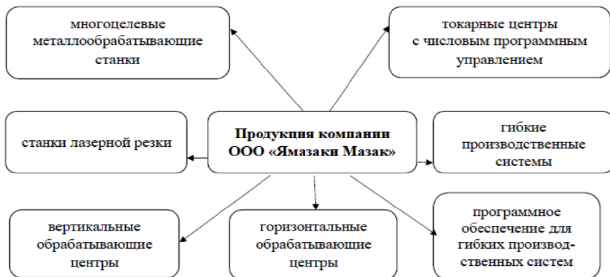
Рис 1. Продукция ООО «Ямазаки Мазак», предлагаемая компанией для российских промышленных предприятий

внешнеторговая деятельность основывается на устойчивом спросе самых различных продуктов не только на социально-индивидуальном уровне [3, с. 50-55; 5, с. 41-45], но и в масштабах межгосударственного взаимодействия. Продукция Ямазаки, отличаясь многообразием, занимает устойчивую нишу экспорта высокотехнологичной продукции на российский рынок.