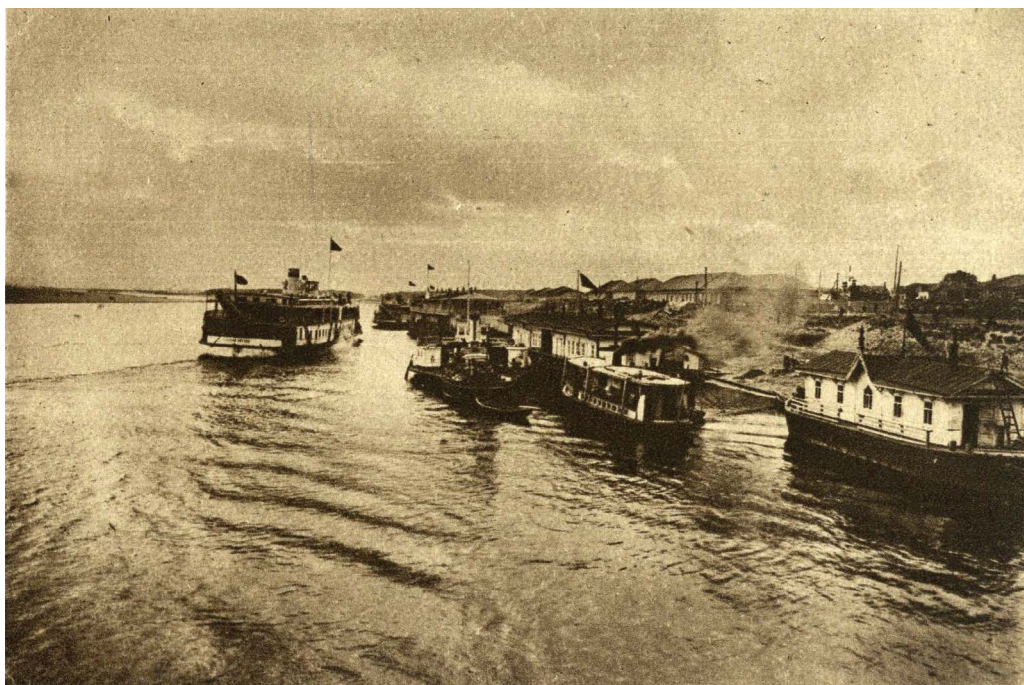
Пристани в устье р. Казанки. Казань, конец XIX в.

The pier at the mouth of Kazanka River. Kazan, the end of XIXth century.