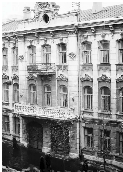
Вид здания редакции газеты «Волжский вестник» (Дом Пермяковых). Казань, конец XIX в. ГА РТ, оп. 1, ед. уч. 4663.

The View of the building of the editorial office of the newspaper "The Volzhsky Bulletin" (House of Permyakov). Kazan, the end of XIXth century. The National Archive of the Republic of Tatarstan, series 1, unit of storage 4663.