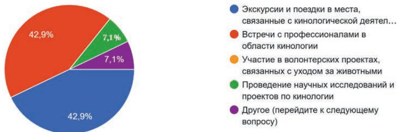
Рис. 1. Формы внешкольной работы наиболее эффективные для развития интересов и навыков обучающегося

места, связанные с кинологической деятельностью и встречи с профессионалами в области кинологии (по 42,9%).