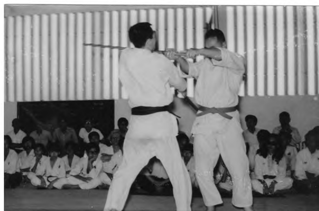
Рис. 2. Сэнсэй Мотидзуки Минору демонстрирует технику с мечом.

ба дзюдо. Все студенческие годы я прозанимался дзюдо. В 1963 году я переехал в Токио, уже устроившись на работу. Через несколько лет я вернулся в Сидзуока и пришёл на постоянное обучение к Мотидзуки сэнсэю в качестве ути-дэси. В этом додзё я провёл 3,5 года, изучая различные виды боевых искусств: айкидо, дзюдо, каратэ, Катори Синто-рю. После того как прошли 3,5 года моего обучения, я перешёл непосредственно к преподаванию. В дальнейшем я сменил несколько мест пребывания, жил и в Нагоя, и в Токио, и каждый раз я открывал собственный додзё, где и преподавал. Тем временем Мотидзуки сэнсэй основал международную организацию айкибудо, одной из целей которой было распространение различных видов будо по всему миру. Я работал в офисе этой организации одним из руководителей. Конечно, основными руководителями этой организации были Мотидзуки сэнсэй и Сугино сэнсэй – именно они отвечали за айки направление и за Катори Синто-рю, но при этом, поскольку цель была в распространении не только этих направлений, но и других единоборств, то они привлекали к деятельности организации передовых представителей других будо. Я там проработал 20 лет. Вот та история, которую я мог бы рассказать на сегодняшний день.