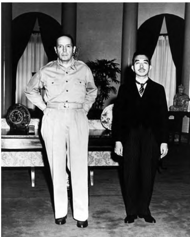
Рисунок 2. Генерал армии США Дуэглэс Мэкартур и император Японии Хирохито на исторической встрече в американском посольстве в Токио.

японец в очках, одетый в довоенный короткий однобортный сюртук с закруглёнными, расходящимися спереди лапами, и в старомодные высокие ботинки, с доходящими до голени кнопками. Как только моя рука опустилась после выполненного воинского приветствия, он приблизился достаточно близко ко мне, чтобы протянуть мне руку для крепкого рукопожатия. Мы обменялись приветствиями и, повернувшись, пошли рядом друг с другом внутрь посольства. Таким образом, в качестве военного секретаря генерала армии Мэкартура, я официально встретил Хирохито – императора Японии. Впоследствии я узнал почти невероятные факты, стоящие за капитуляцией Японии.