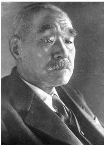
Рисунок 5. Судзуки Кантаро (1867–1948) - военный и государственный деятель, адмирал и премьер-министр Японии с апреля по август 1945 г.

Императором в этой связи было принято решение о ещё более смелом шаге. Жесткий, непримиримый борец, 77 летний Кантаро Судзуки, настолько откровенный пацифист, ставший жертвой покушения во время восстания, так называемых, «молодых милитаристов»