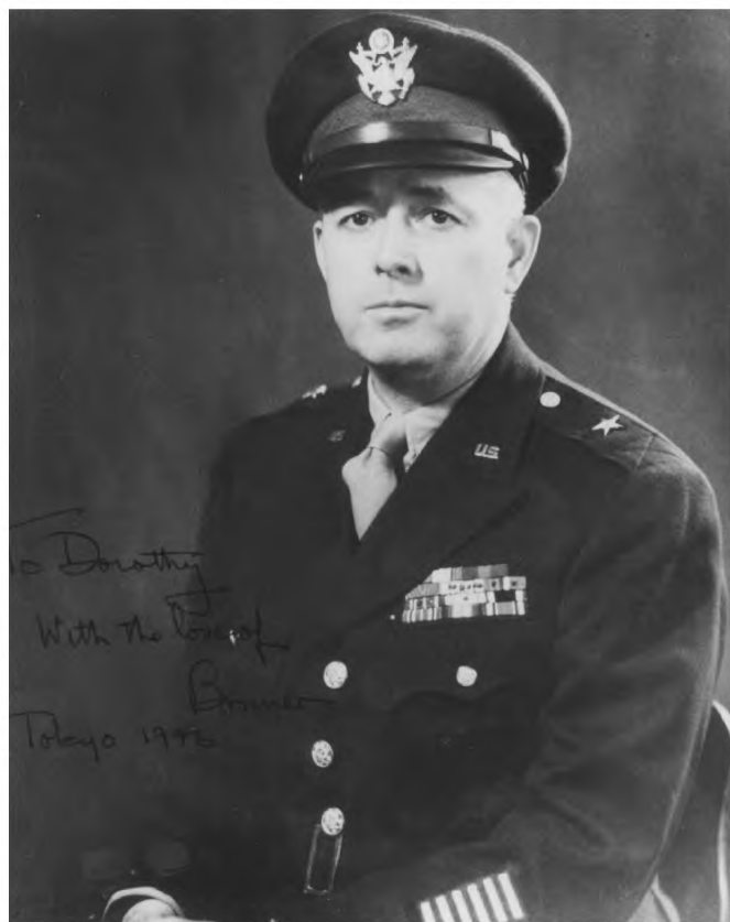
Рисунок 1. Боннер Фрэнк Феллерс.

Статью Б. Феллерса необходимо читать и использовать осторожно, понимая для каких целей она написана. Изложенные в ней факты поданы в необходимой для замысла автора манере. Однако при этом данная статья является важным историческим источником, освещающим политические процессы после Второй мировой войны. Кроме того, она проливает свет на некоторые важные вопросы истории МВТДВ, одной из главных проблем которого до сих пор считается непривлечение императора и членов его семьи к суду.