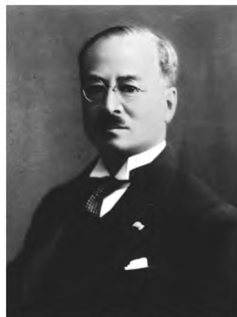
Рисунок 7. Кидо Коити - лорд-хранитель печати, японский политический деятель, доверенное лицо императора (1889 - 1977).

утверждая, что ответ союзников означал отмену системы императорской власти. Между тем, американские самолеты по всей стране сбрасывали копии Потсдамской декларации и ответа Японии на нее.