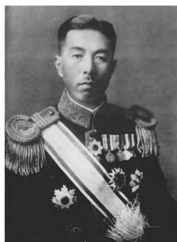
Рисунок 3. Принц Коноэ Фумимаро

ками, в которых СССР должен был выступить в качестве посредника, еще за шесть месяцев до капитуляции Японии. Хладнокровно в своих собственных интересах СССР планировал занять доминирующее положение на Востоке, как в территориальном плане, так и в политическом, для достижения этой цели СССР планировал вступить в войну с Японией в наиболее благоприятное для него время. В результате проведенного мной расследования, основанного на допросах членов кабинета Хирохито и других высокопоставленных чиновников, а также истории рассказанной лично императором, я выяснил, что СССР, выдвигая грабительские требования в качестве платы за посреднические услуги между Японией и США, сделал все возможное, чтобы задушить первые попытки японцев добиться разумной капитуляции в течение всей зимы и весны 1945 года. В июле СССР снова заблокировал попытку капитуляции, не приняв в качестве официального посланника императора Японии принца Коноэ, уполномоченного сдаться и добиться мира.