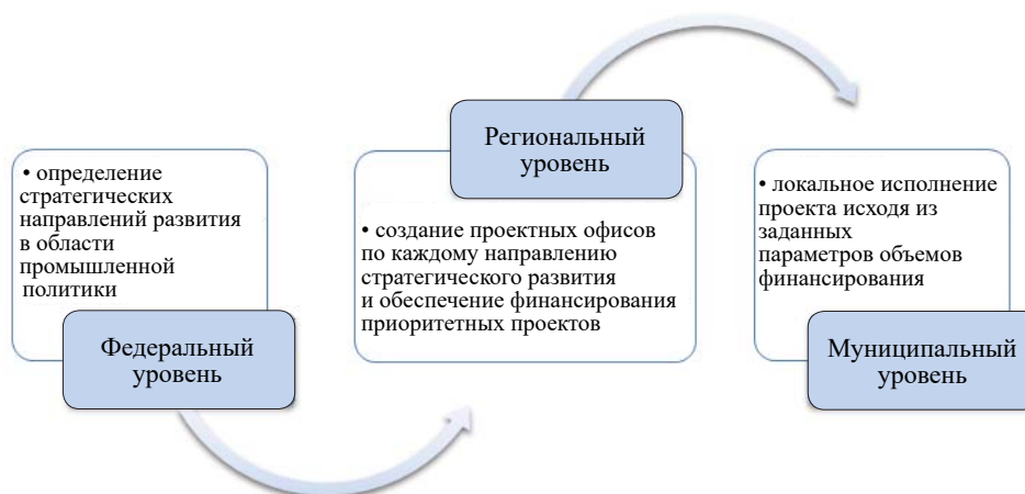
Рис. 1. Региональное формирование проектных офисов (составлено автором)

скрытых рисков и барьеров к успешной реализации проектов, управление выгодами и обязательное содержательное и календарно-сетевое планирование, а также контроль за ходом работ по участию в реализации промышленной политики в курируемой отрасли.