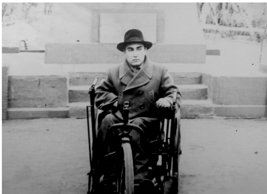
Рис. 4. Александр Сергеевич Марков. 1961 г.

с бакинской портовой таможенной об имуществе после умершего посла в Персии статского советника Грибоедова». Когда я увидел это дело, я просто поразился. Какие могут быть вещи Грибоедова, когда везде пишут, что никаких вещей не осталось, что все было разграблено, а все члены миссии, кроме одного, были убиты? Чудом спасся только Мальцев, а остальные все были убиты, и само тело Грибоедова целый день лежало на площади на жаре. После этого обезображенный труп еле опознали. Пушкин писал, что его опознали только потому, что нашли оторванную руку со следами пушечной пули, которая была следствием поединка. Первого декабря я нашел это дело и заказал его. Я думал, там будет описание имущества, но этой описи не оказалось, а было только сообщение, что 30 января 1829 г. на лодке зензилинского персиянина Ага Метадонафарова были привезены в Баку 50 ящиков с вещами Грибоедова и членов его миссии. И было приказано составить описание всех этих вещей в бакинской таможене и некоторые вещи отправить в Тифлис, но почему-то не жене Нине Грибоедовой, а родственнику, поэтому