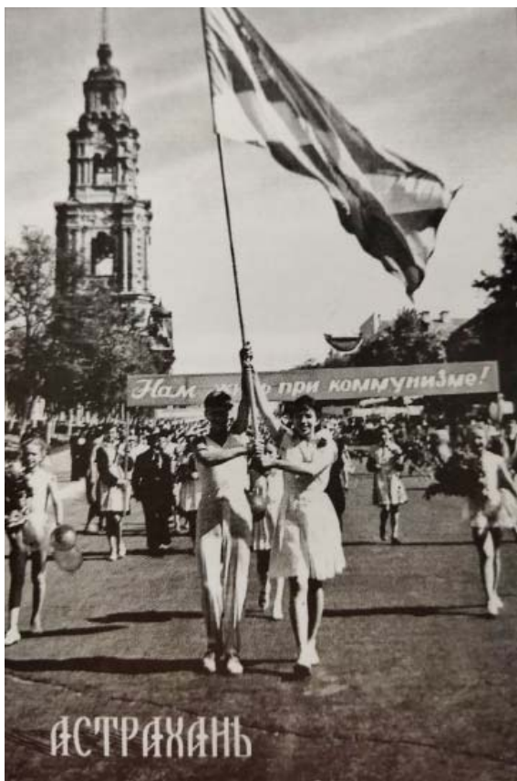
Рис. 5. Открытка. Первомайская демонстрация у стен Астраханского кремля. 1960-е гг.