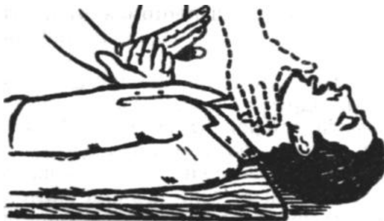
Рис. 1.2. Непрямой массаж сердца.

касаться грудной клетки (рис. 1.2). Затем энергичными ритмичными движениями надавливают на грудную клетку с такой силой, чтобы прогнуть ее в сторону позвоночника на 4 - 5 см. Частота нажатий 60 - 80 раз в минуту.