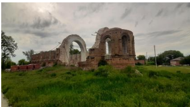
Рис. 2. Вид на здание храма с юго-восточной стороны