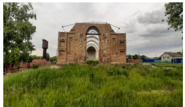
Рис. 3. Западный фасад храма (притвор)