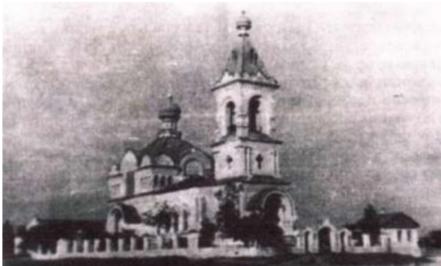
Рис.1 Архивное фото

коллективизацией (с 1928 до 1937) местный комсомольский актив сбросил с него колокола и кресты, устроив обыкновенную кровлю, и организовали в нем колхозный склад. Хотя храм удалось сохранить от полного уничтожения, в качестве религиозного сооружения он не функционирует и до сих пор. Ситуация с состоянием конструкции храма усугубилась после 2018 года, когда кровля здания была полностью разрушена, и все строительные конструкции стали подвержены атмосферным осадкам (по состоянию на август 2022 года большинство его элементов разрушены (рис.1-8). Это и привело к необходимости разработки проекта консервации храма [4,5].