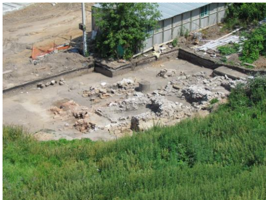
Рис. 1. Болгарский историко-археологический комплекс. Баня №2. Общий вид раскопа CLXXII с юго-запада.