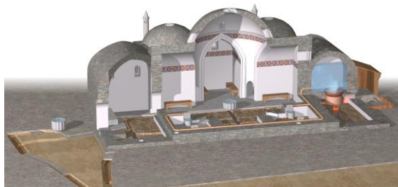
Рис. 2. Реконструкция бани №2 (выполнена Д.И. Неяченко по материалам С.Г. Бочарова и А.Г. Ситдикова).