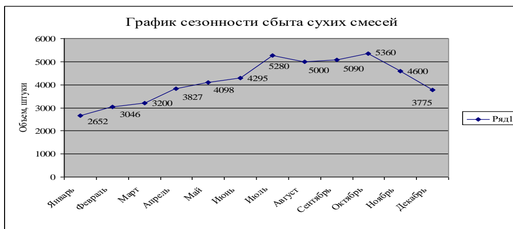
Рис. 2. График сезонности сбыта ЦПС и шпатлевки на предприятии ООО «Альфа» (предыдущий год)

Соотношение производства ЦПС и шпатлевки: примерно в среднем 60/40 соответственно. Производство сухих строительных смесей носит сезонный характер.