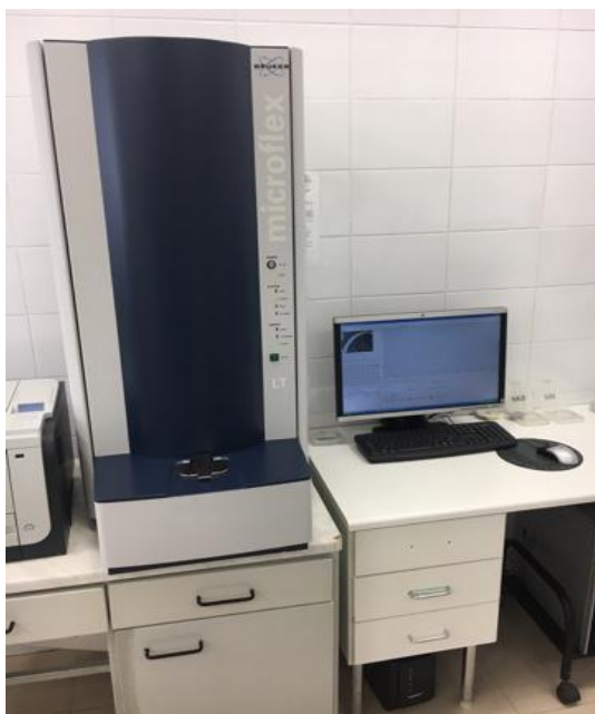
Рис. 3 Масс-спектрометр «MALDI TOF microflex LT».