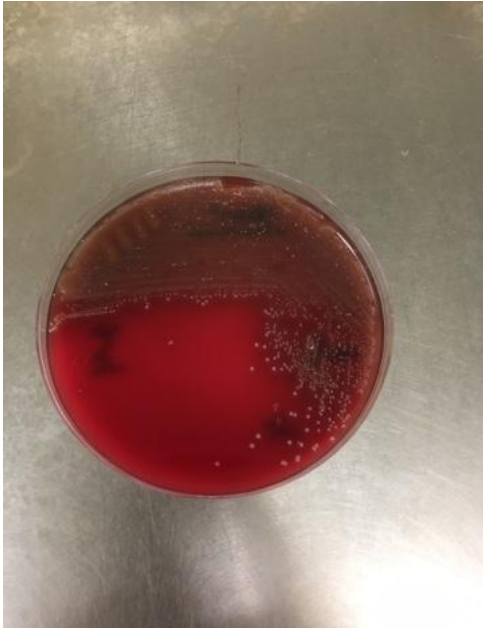
Рис.1 Кровяной агар с культивацией аэробов.