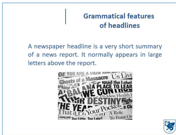
Рисунок 2. Пример оформления теоретического материала “Grammatical features of headlines”

Теоретический материал для подтемы “Grammatical features of headlines” представлен в ЦОР в виде презентации (Рисунок 2).