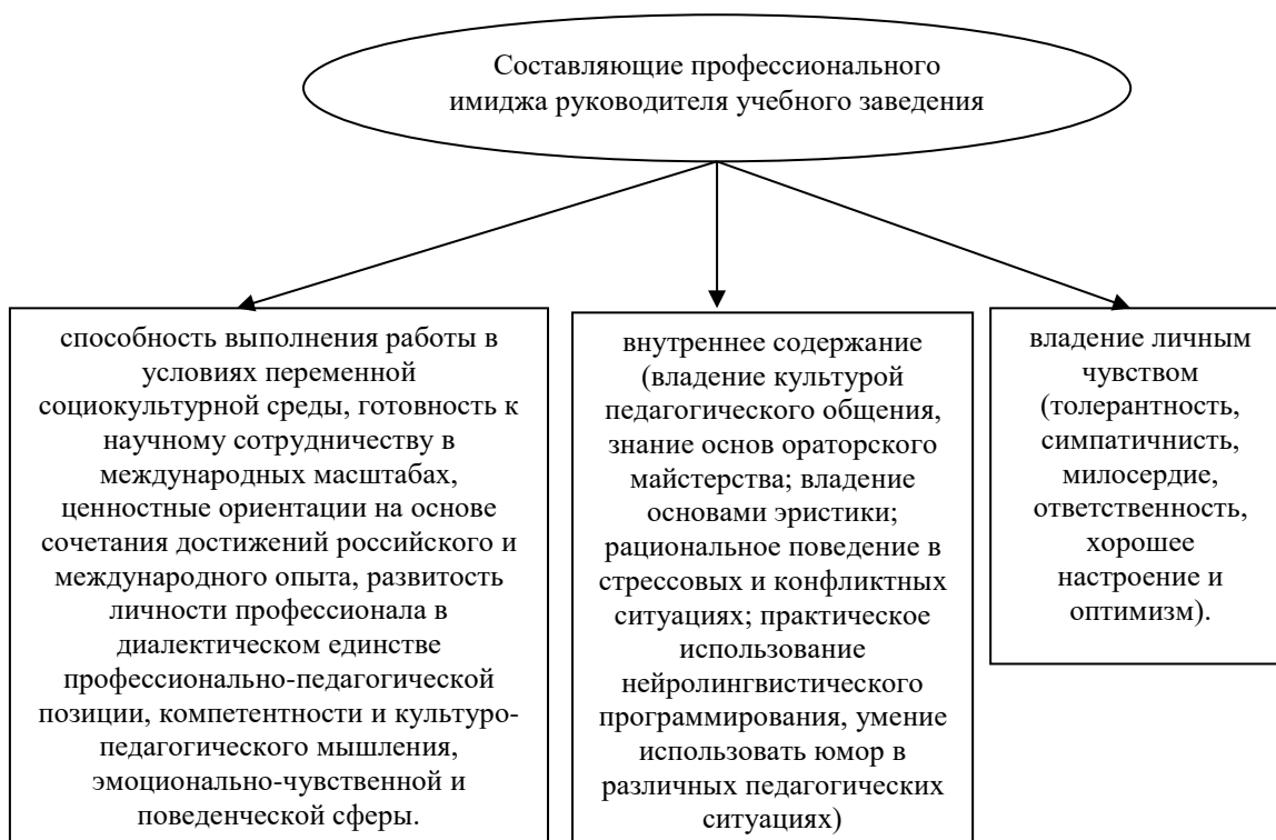
Рисунок 1 - Составляющие профессионального имиджа руководителя учебного заведения* (*Разработано авторами на основе [2, 3])

Кроме профессионального имиджа, важное значение имеет и социальный имидж личности руководителя.