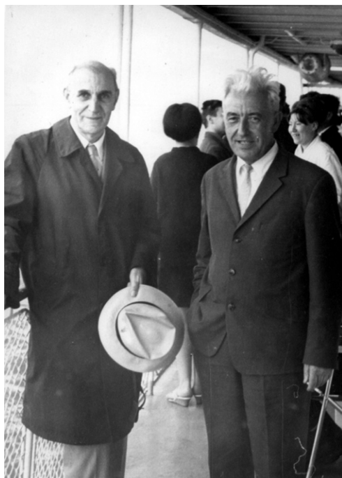
С лауреатом Нобелевской премии А. Кастлером на Волге, во время международной конференции 1969 г.

и исторические моменты. На конференции была выставка аппаратуры зарубежных фирм, при этом значительная часть привезенных приборов осталась в Советском Союзе. В целом конференция оставила значительный след, связала многих ученых с их коллегами из других стран и регионов, вдохновила на дальнейшие исследования». Этот форум существенно поднял авторитет Казанской физической школы.