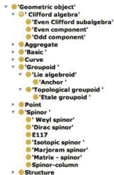
Рис. 3. Фрагмент онтологии OntoMath PRO

ление, ссылки на внешние ресурсы из облака Linked Open Data и связи с другими концептами. Объектами семантического аннотирования также являются формулы, связанные с формулами фрагменты текста, задающие описание переменных формул [17, 27, 28].