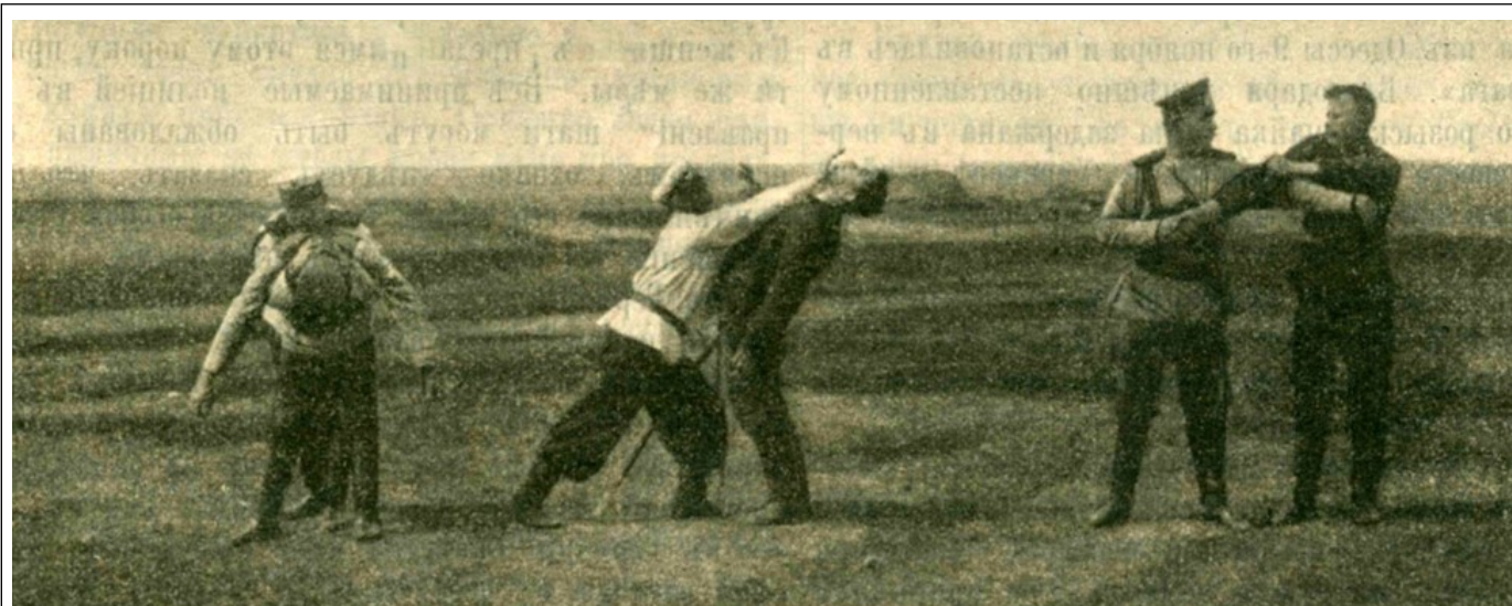
Рисунок 2. Обучение стражников Саратовской губернии приемам японской борьбы («Вестник полиции», 1908 г., № 48, с. 11, фото 2)