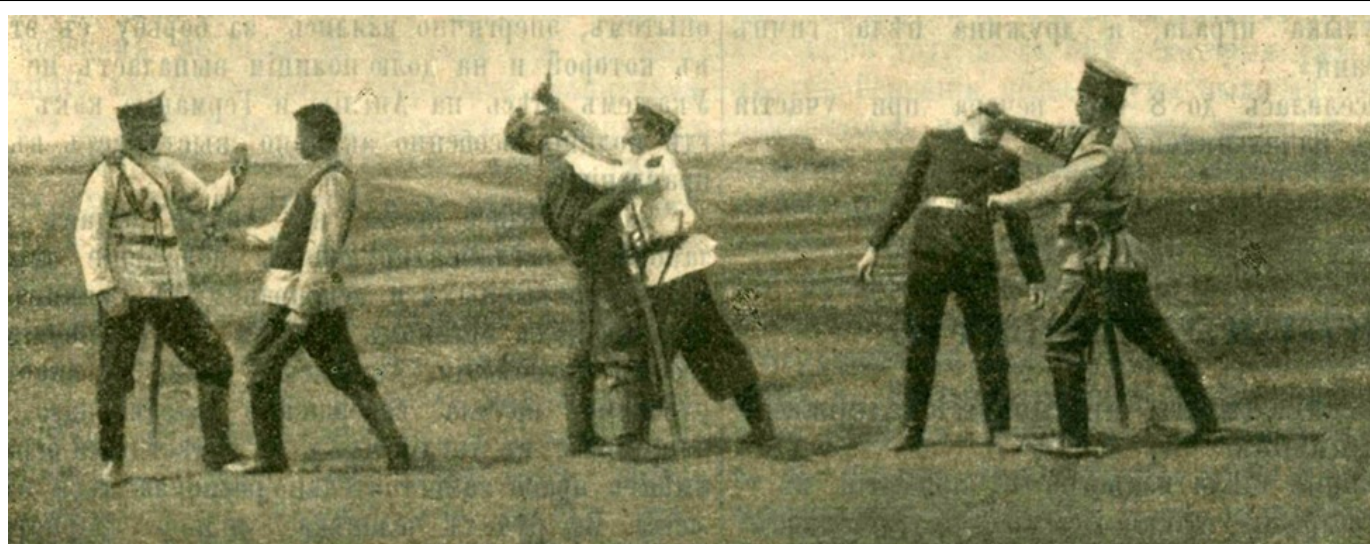
Рисунок 1. Обучение стражников Саратовской губернии приемам японской борьбы («Вестник полиции», 1908 г., № 48, с. 11, фото 1)

компиляцию из появившихся в русском переводе наставлений к изучению Жиу Житсу», его книга является, безусловно, авторской. Под компиляцией Демерт, по всей видимости, подразумевал, что он отобрал наиболее полезные приемы из различных книг по джиу-джитсу. Однако все описания приемов и фотографии в книге созданы Демертом на основе его личного опыта.