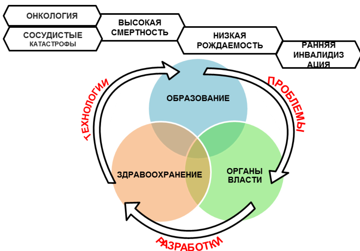
Рис. 1. Организационный механизм: тройная спираль

отрасли обмениваются знаниями и практикой, формируя совместное видение в отношении мер адаптации к гиперизменчивой среде. Благодаря такому видению участники трансотраслевого партнерства могут принимать более эффективные решения по сравнению с индивидуальными, применяя механизм коллективной фильтрации, а также эффективно объединять усилия для совместного создания новых общественных благ, применяя механизм коллективного создания инноваций. Причем это видение непрерывно корректируется в ходе взаимных согласований, формируя основу для генерирования инноваций в непрерывном режиме.