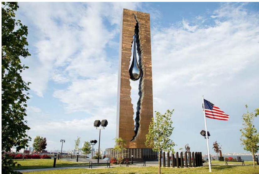
Монумент жертвам международного терроризма «Слеза скорби» (З.К.Церетели) в городе Байонн штата Нью-Джерси в США [30]

картин «Бомба», «Бомбы», «Бомбист», «Бомбисты», «Взрыв» и «Террор».