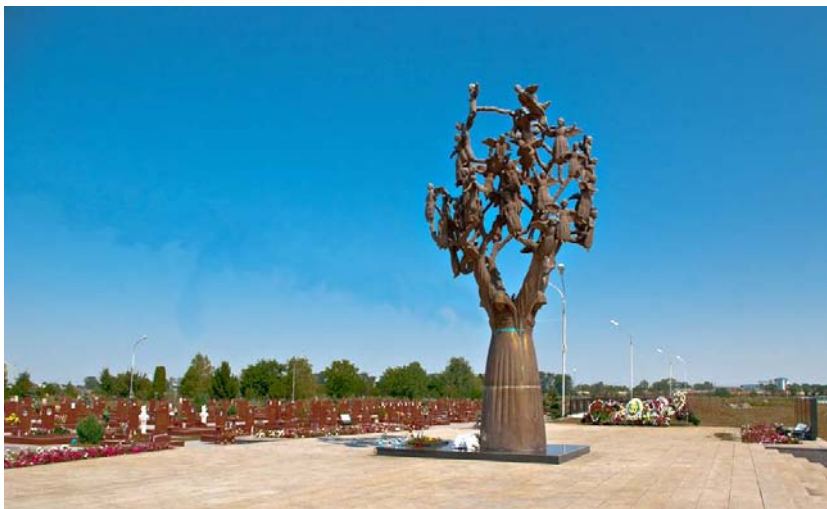
Город ангелов. Древо скорби. Беслан. Северная Осетия – Алания [27]

каждой из которых выгравированы имена более 3000 жертв теракта 11 сентября 2001 года, а также имена тех, кто погиб во время атак на Всемирный торговый центр в 1993 году. К основанию ведут девять дорожек» [12]. Не менее символична и длина слезы – 11 метров. Символика цифр связана с да-той трагедии.