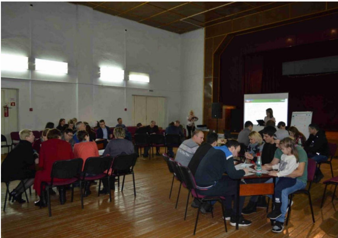
Рис. 2. – Организация общественного обсуждения по молодежному центру «СинЭнергия» п.г.т. Алексеевское, 2020 год

Пространство, которое примет у себя в будущем молодежь, должно быть ментально единым, для самой молодежи оно должно считываться, как «своя среда», комфортная, модная и привлекательная. Чтобы добиться желаемого результата в работе с молодежью, в первую очередь проводятся общественные обсуждения, на которых целевой аудитории предлагается выразить все свои пожелания в устной, текстовой и графической формах, при этом на первоначальном этапе молодежь может формировать свои запросы на бытовом уровне и формулировать их весьма просто, к тому же, среди предложений по деятельности будущих объектов могут появляться распространённые виды развлечения типа боулинга, бильярда и т.п. На рис.2 представлено, как проводятся общественные обсуждения [6,7].