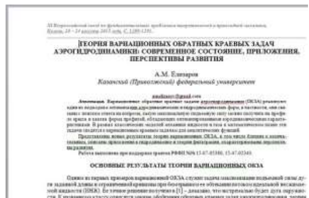
Рис. 5. Фрагмент документа после обработки модулем (создан колонтитул с выходными данными)