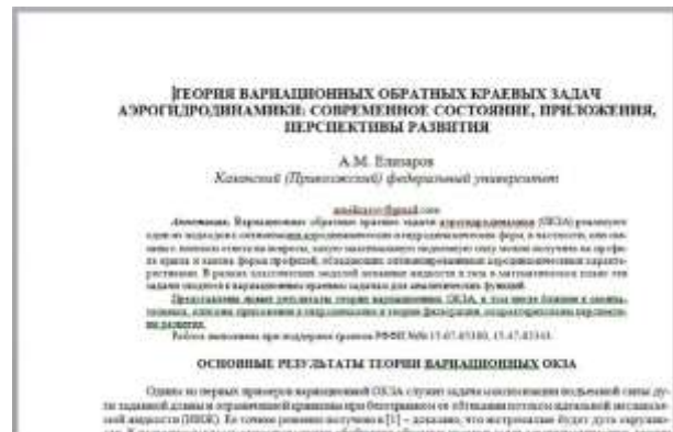
Рис. 4. Фрагмент документа до обработки модулем

Этот модуль позволяет в автоматическом режиме подготовить из файлов электронной коллекции оригинал-макет научного издания (сборник материалов, труды и т. д.). Порядок размещения статей определяется семантическим представлением коллекции, хранящемся в XML-файле (см. раздел 5). Алгоритм реализован в виде макроса VBA и включает следующие шаги: сначала для задания диапазона страниц статей определяются счетчики начальной и конечной страниц и задаются их начальные значения (см. рис. 4–6). Далее последовательно открываются документы коллекции в соответствии с порядком, заданным в XML-файле в соответствии с правилами извлечения. Вычисляются начальные и конечные страницы, после чего формируется библиографическое описание статьи, которое записывается в колонтитул данного документа. Полученный документ конвертируется в PDF-формат. Также библиографическое описание сохраняется в XML-файле. На рис. 6 приведен фрагмент кода, выполняющий описанные операции.