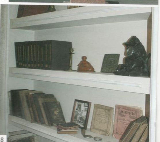
1. Фрагмент экспозиции «Женская комната». 2. Фисгармония («домашний орган»). 3. Елабужский купец 1-й гильдии В.Г. Стахеев. 4. Попечительница Елабужского Стахеевского епархиального училища Г.Ф. Стахеева. 5. Участники театрализованной постановки. 6. Памятник Д.И. Стахееву. 7. Предметы обихода купеческого дома конца XIX в. 8. Фрагмент экспозиции купеческого дома.