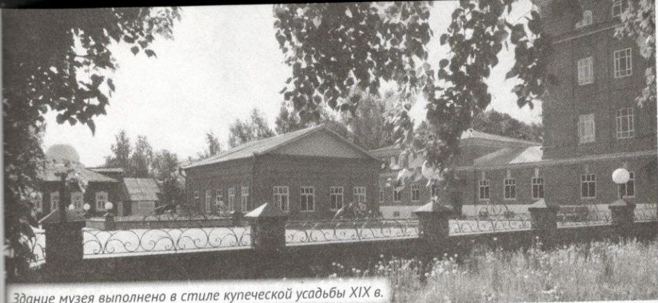
Здание музея выполнено в стиле купеческой усадьбы XIX в.

купеческого быта, роскошная мебель, посуда, документы, фотографии.