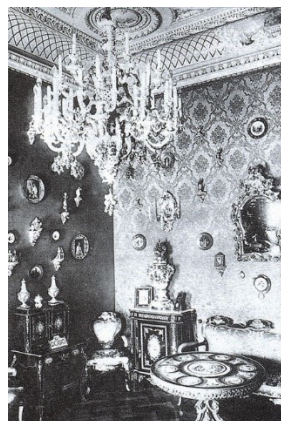
Рис. 4. К. Л. Мюфке «Дом Ушковой». Будуар. Розовая гостиная

Спасением было найдено, и оно виделось передовыми архитекторами в металлических стойках и ригелях инженерных конструкций. Именно инженерные стойки и ригели, изготовленные из проката, возвращали архитектуру в лоно конструктивного ордерного искусства древних греков и римлян. Стойки из металлического проката заменяют колонны храмов Древней Греции, а стекло будет символизировать просветы между ними. Металлические стойки и ригели снова будут выполнять утраченную ими несущую функцию.