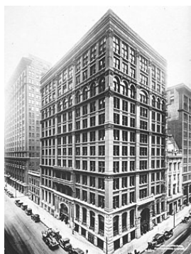
Рис. 5. Уильям Ле Барон Дженни. Здание страхования жилья. Чикаго. Фото. 1884 г.

Таким образом, архитектура, основанная на ремесленном создании построек из кирпича и мраморных или каменных блоков, на ордерной системе Античности и достижениях объемно – пространственной композиции Средневековья должна была измениться. И этот процесс мы наблюдаем на всем протяжении XX – начала XXI века.