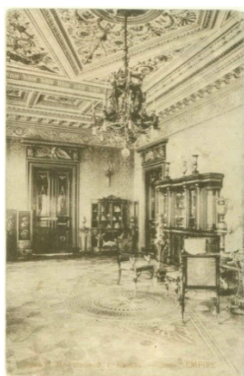
Рис. 3. К. Л. Мюфке «Дом Ушковой». Интерьер

Архитектурные элементы и декор в отдельности были прекрасными, но их обилие и эклектичное соединение становилось примером безвкусицы. Знаменитый казанский «Дом Ушковой» превратился в «торт» с рустом и пышными сандриками окон, элементами условного изобразительного языка барокко, «щинаузри», мавританского искусства, элементов архитектуры ренессанса. Наше мнение состоит в том, что все это смешение «парижского и нижегородского» на основе безудержных финансовых трат купца-заказчика превращается в местечковую «развесистую клюкву», вызывая интерес и восхищение современных обывателей «Домом Ушковой», который можно отнести к нереальной сказочности и китчевой «чудаковатости» образа данного объекта.