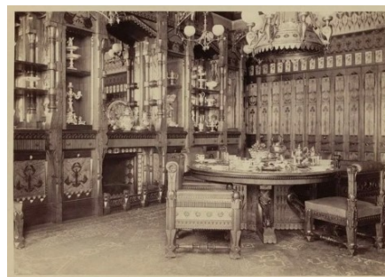
Рис. 1. Интерьер столовой в доме Теодора Рузвельта – старшего

Первые автомобили с деревянными колесами и бензиновым двигателем, напоминающие в экстерьере конную пролетку, здания радио - станций, телефония. Все это требовало пересмотра композиционных форм во всех исторически сложившихся, видах изобразительного искусства и дизайна.