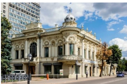
Рис. 2. Л. К. Мюфке «Дом Ушковой». Казань

формы. Искусственно созданные организмы рассматриваемой нами эпохи часто страдали пресыщенностью декором, транслирующим архитектурные элементы различных эпох и исторических стилей. Историзм в архитектуре кон. XIX в. становился в русле обилия архитектурного декора, «рассказа», «переслащенности» ярким примером китча.