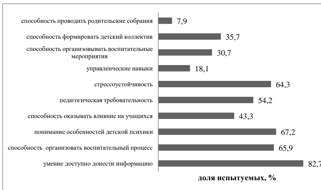
Рис. 2. Распределение ответов родителей на вопрос о профессиональных умениях и навыках, которыми должен обладать идеальный классный руководитель

Мы также попросили родителей перечислить профессиональные умения и навыки, которыми должен обладать классный руководитель (рис. 2).