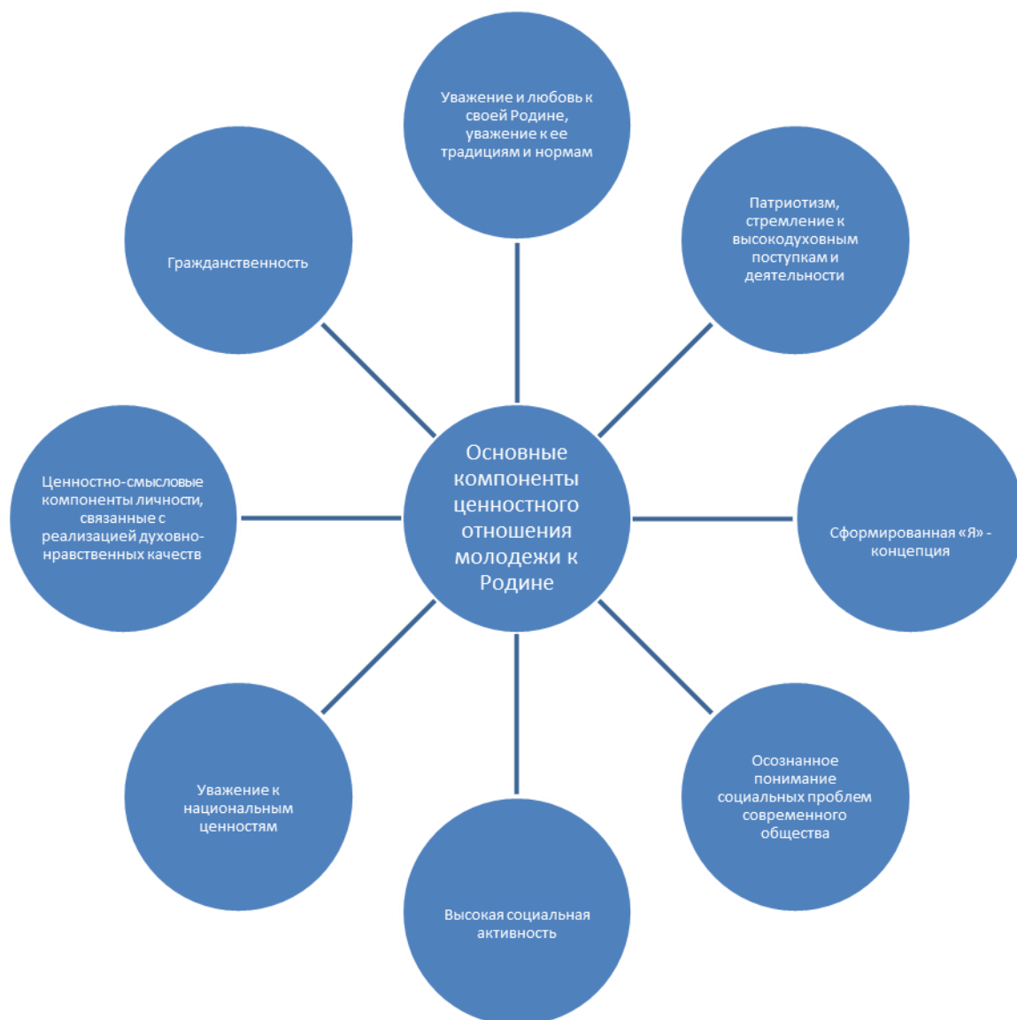
Схема 2. Основные компоненты ценностного отношения молодежи к Родине

Таким образом, ценностное отношение к Родине как важнейший компонент воспитания молодежи имеет мощный нравственный потенциал для введения молодых людей в мир ценностей, а также для оказания помощи им в выборе личностно-значимых ценностных ориентаций. Однако, чтобы сформировать у молодежи осознанное отношение к своей Родине, воспитать национальное самосознание и патриотические качества, расширить их знания об истории и культуре родного края, о народном художественном творчестве своих земляков, руководителю необходимо и самому обладать такими качествами, как гражданственность и высокая культура, проявлять высокую