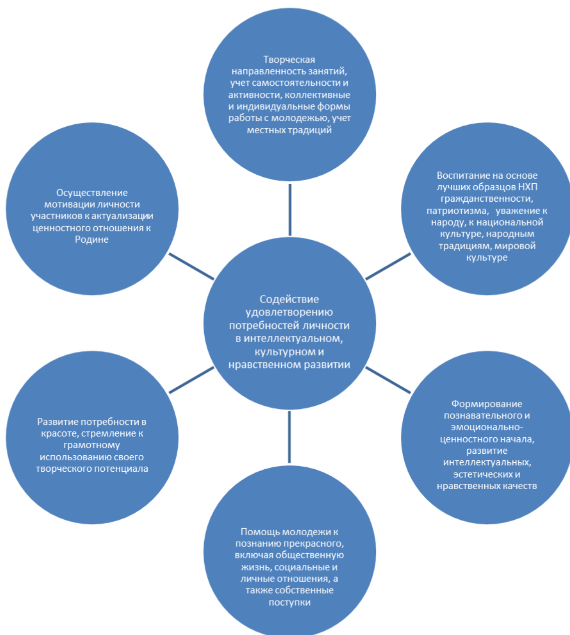
Схема 3. Педагогический потенциал народных художественных промыслов в формировании ценностного отношения молодежи к Родине